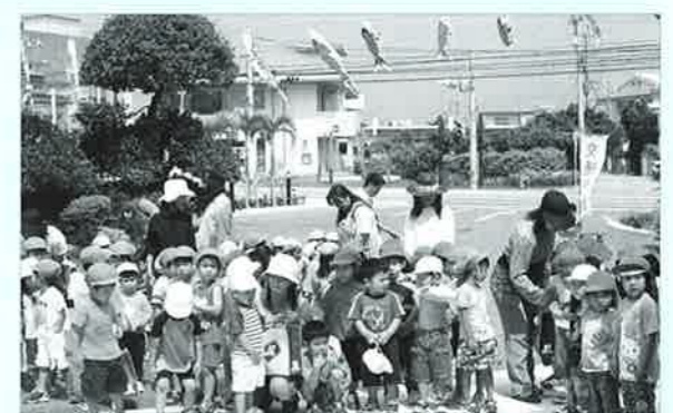
▲鯉のぼり掲揚式に参加した子どもたち