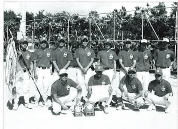
▲ 第24回恩納村各字対抗ソフトボール大会で11年ぶり、4回目の優勝を果たした塩屋体協選手のみなさん