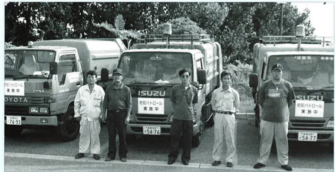
▲清掃業者による「クリーン防犯パトロール隊」