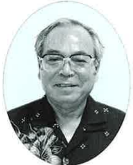
真栄田区長 長 浜 長次郎