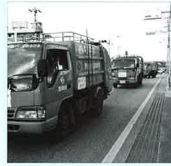
▲クリーン防犯パトロール隊出動！

五月十二日、恩納村役場において「防犯パトロール実施中」と表示されたマグネットステッカーの贈呈式が行われ、燃えるごみを収集する清掃業者に贈呈されました。式には、石川警察署地域課、恩納交番長、石川地区防犯協会恩納村支部事務局長が出席しました。マグネットを贈呈された清掃業者は「クリーン防犯パトロール隊」として、月曜日から土曜日の午前中、村内全域をくまなく巡回し燃えるごみの収集作業に当たる際、防犯パトロールを実施、不審者等を発見した場合は、警察へ通報するという仕組み。