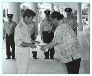
▲防犯協会恩納支部から清掃業者(左)へマグネットの贈呈

五月十二日、恩納村役場において「防犯パトロール実施中」と表示されたマグネットステッカーの贈呈式が行われ、燃えるごみを収集する清掃業者に贈呈されました。式には、石川警察署地域課、恩納交番長、石川地区防犯協会恩納村支部事務局長が出席しました。マグネットを贈呈された清掃業者は「クリーン防犯パトロール隊」として、月曜日から土曜日の午前中、村内全域をくまなく巡回し燃えるごみの収集作業に当たる際、防犯パトロールを実施、不審者等を発見した場合は、警察へ通報するという仕組み。