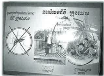
▲ クメール語とイラストでマラリアを説明した教材

ある現地の方が、カンボジアはアジアのなかでもいちばん下なので援助の見込みがないからアジアから見捨てられているけど、日本はよく援助してくれるので日本人に感謝していると話してくれました。