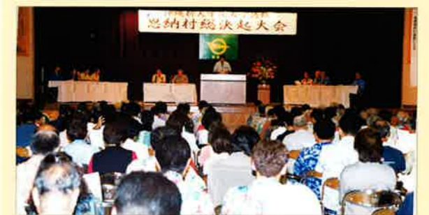
▲会場には多くの村長が訪れ開催されました

〈大会スローガン〉 一、世界最高水準の研究・教育機関の集積や地域経済の活性化を図る沖縄新大学院大学を恩納村に誘致しよう。 一、「青と緑の躍動する村」づくりのため、自然科学系の沖縄新大学院大学を恩納村に誘致しよう。 一、沖縄とアジア・太平洋地域の先端頭脳集積地域として発展させ、産業界との連携を図る沖縄新大学院大学を恩納村に誘致しよう。 一、恩納村の恵まれた自然環境を活用し、国際性に富んだ人材の育成を目指す沖縄新大学院大学を恩納村に誘致しよう。