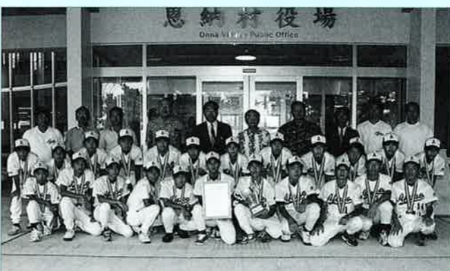
▲役場玄関前で記念撮影