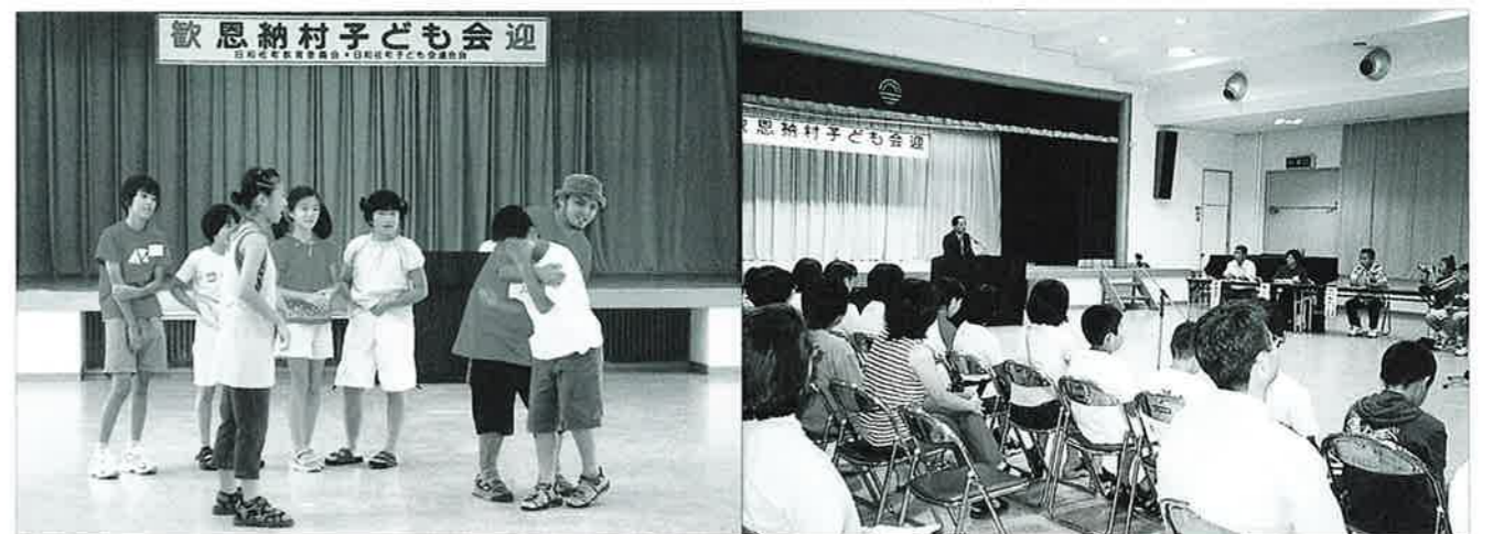
▲恩納村のリーダーの進行で楽しいゲーム