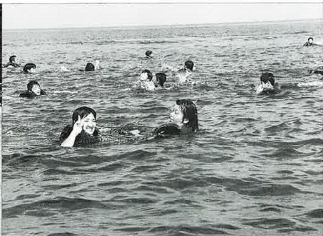
▲約1キロの遠泳にも元氣に挑戦