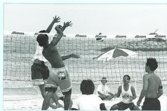
▲ビーチバレーで夏恩納を内外にPR