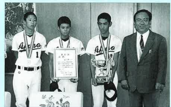
▲大城村長に優勝報告を行う知名校長