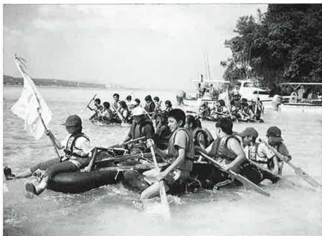
▲手作りイカダで南恩納船着場向け出発！