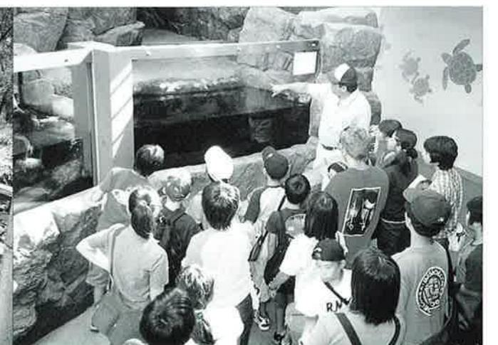
▲日和佐町海亀博物館で海亀についての説明を受ける