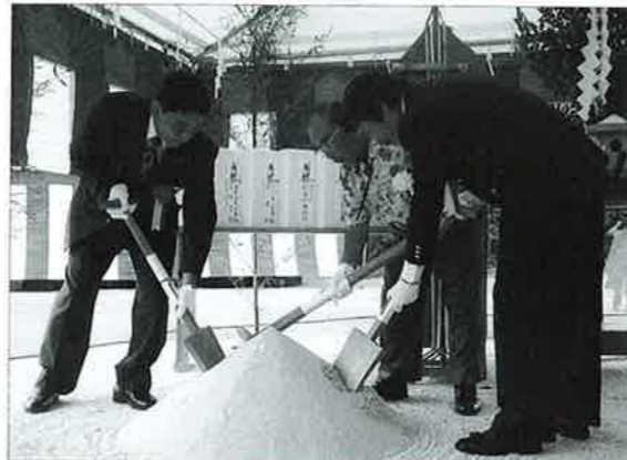
▲工事の安全を願い鉄入れ