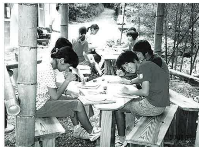
▲陶器の物づくりに挑戦