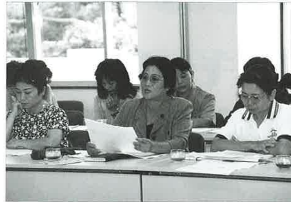
▲婦人の立場から意見を述べる会員