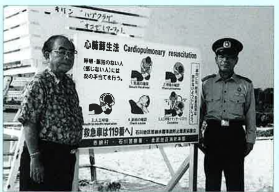
▲村では石川警察署・金武地区消防と協力して心肺蘇生法と車上狙い注意の看板を村内10カ所に設置（海浜を中心に）