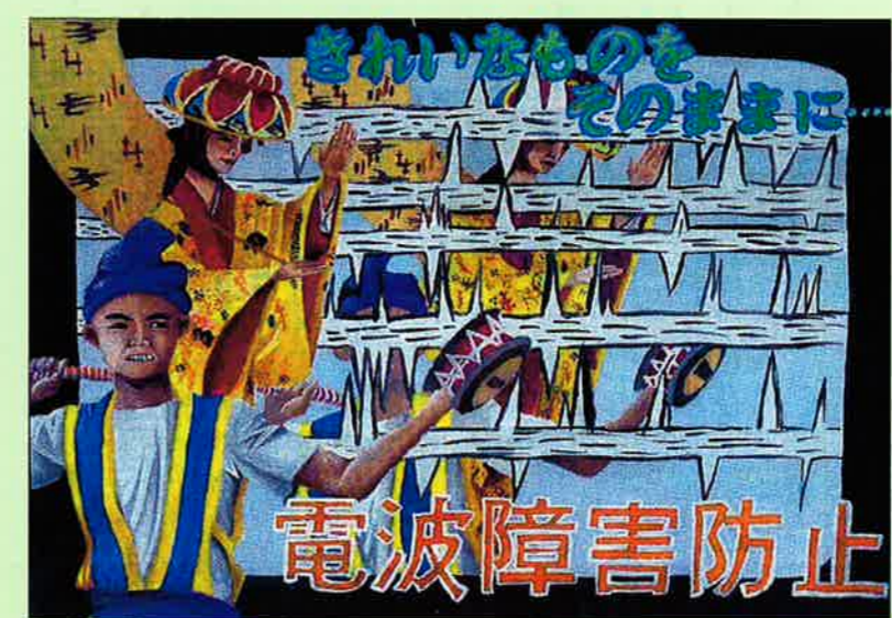
平成12年度受信環境クリーン図案コンクール入賞作品

受信障害とは、建造物、電気雑音、配送電線、 不法無線局などが原因となって、テレビ・ラジ オ放送の受信に障害を与えることをいいます。 受信障害については、「沖縄受信環境クリーン 協議会」または、「放送局」へご相談ください。