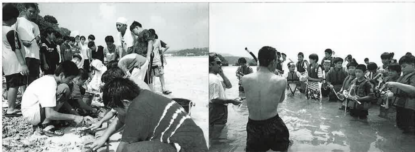
▲皆で協力して魚をこしらえました