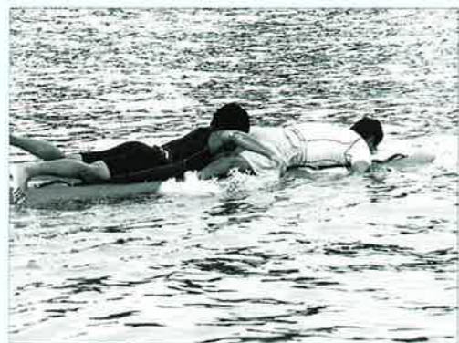
▲ボートを使っでの救助法も紹介