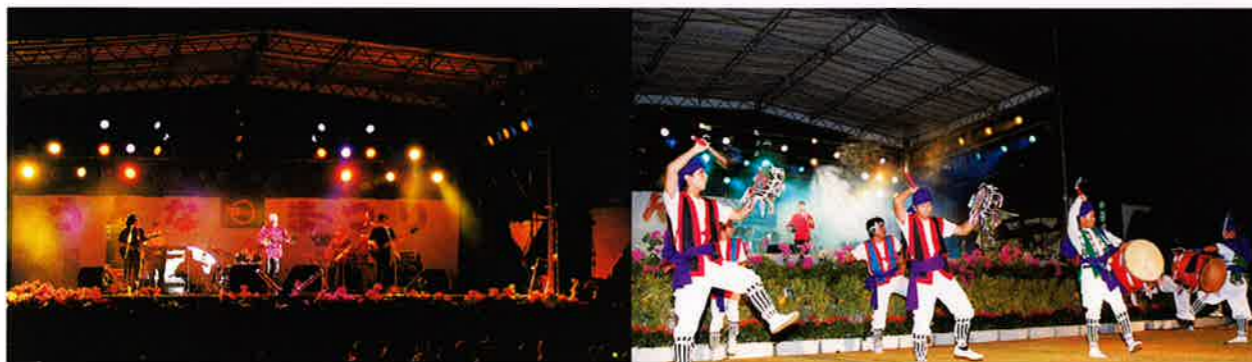
▲まつりフィナーレはパーシャクラブコンサート