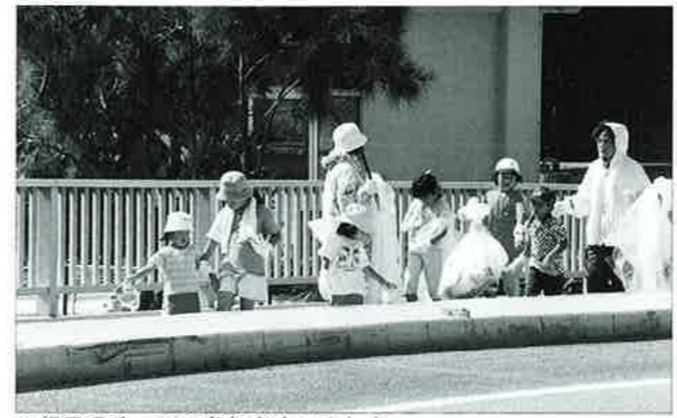
▲親子そろっての参加者もいました

村内の豊かな自然と景観を村民並びに村内事業所が参加して7月27日、村民参加のもと海に親しみながら環境美化を図ろうと「ビーチクリーンアップ大作戦」が村内一円で開催されました。 クリーンアップ大作戦では、参加団体の各事業者、自治会、各団体、村建設業者会が村コミュニティセンター前駐車場で行なわれ出発式の後、それぞれの割当てられた地域の美化活動を実施し、当日回収されたゴミは村建設業者会から提供された車両が各集積場所から回収しました。 ご参加をいただきました皆様、暑い中ご協力いただきましてありがとうございました。