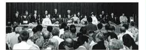
文化協会による幕開け