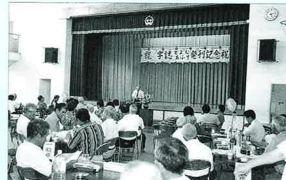
▲8月4日に開催された安富祖区での発刊祝賀会