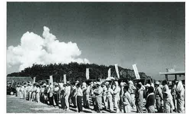
▲多くの関係者が参加して行われた開会式