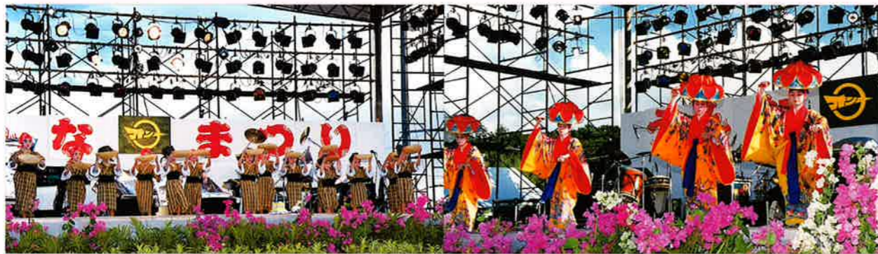
▲子ども達も舞台上で芸能を発表