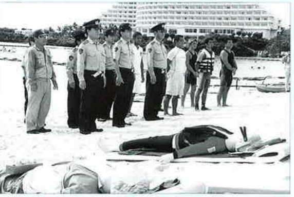
▲関係者団体が訓練に参加