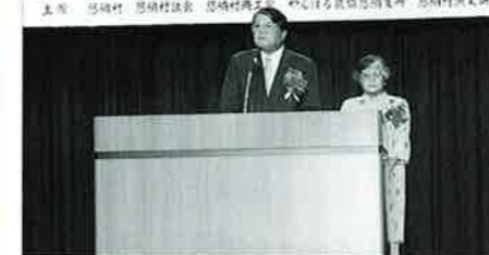
▲副知事就任のあいさつを述べる比嘉氏