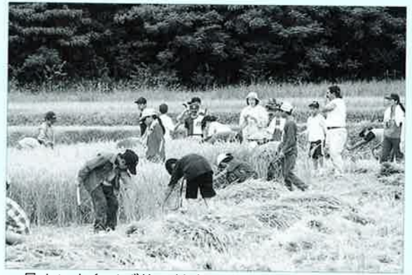
▲暑さにも負けず皆で協力

今年三月に村子ども会が田植えを行なった安富祖区内の田んぼで六月二十九日、稲刈りを経験させる勤労体験学習が開催されました。 学習会には、村内各区から約八十名の子ども達が稲刈りに挑戦。はじめに指導者から鎌の使い方や刈取りの方法を教わった後、参加した子ども達が暑さにも負けずに頑張って約四百坪を 一時間足らずで刈取り、刈取った稲も皆で協力して、脱穀機に稲を運び脱穀まで行ないました。 刈取りした稲は、ひとめぼれと言う品種で、事業を主催した村子ども会と教育委員会では、これから夏休みにかけて開催されるサバイバルキャンプ等で使用することにしている。