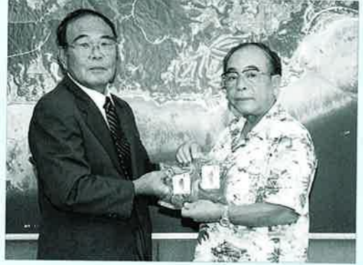
▲にがうり漬けを大城村長に紹介