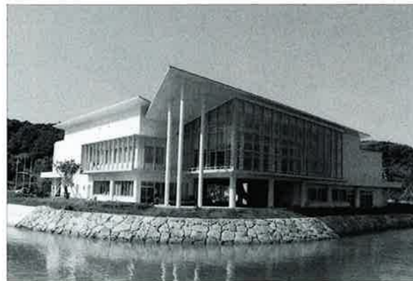
▲ 5月1日に開館した恩納村博物館