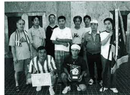
卓球大会アベック優勝の仲泊チーム