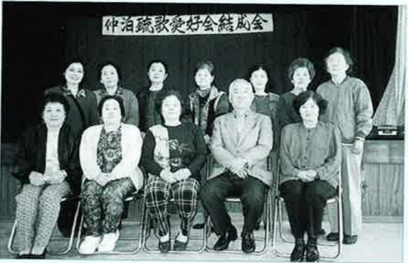
▲仲泊公民館で開催された結成会