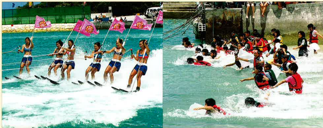
▲リゾートホテルから水上スキーも披露