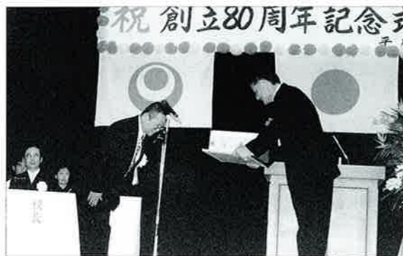
▲記念式典で感謝状が贈呈されました

ゴミ置き場が完成する前までは、野良犬等にゴミが荒らされていたが、学校ではこれから整理整頓をして、有効に活用することで恩返ししたいとお礼を述べていました。