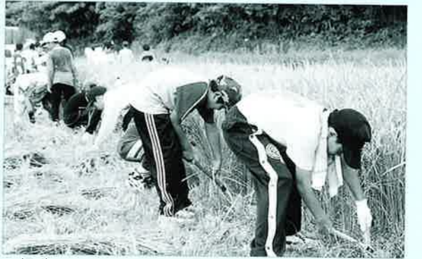
▲怪我のないよう慎重に刈り取りました