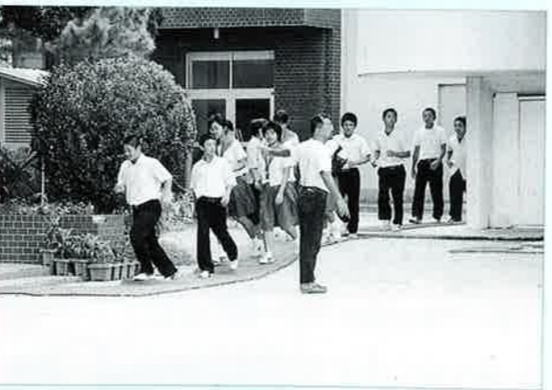
▲先生の誘導で体育館に非難

大阪府で発生した学校内での児童殺傷事件の概要から、緊急事態が発生した場合の安全確保について校内の安全体制確立を図ろうと六月二十二日、安富祖校で石川警察署と協力して防犯診断並びに模擬訓練が行なわれました。 訓練では、ナイフを持った犯人役の警察官が校門から大声を出しながら入って来た所を、先生方が竹馬やモップを 使って取り押さえ、児童生徒は先生の誘導で体育館に非難させました。 同校では、今回の模擬訓練を実施したことで訓練の成果が生かせるように、常日頃から危機管理について考え、校内の施設設備の点検を徹底し関係機関や地域父母との連携を強化して行きたいと考えている。