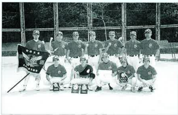
▲2度目のV達成塩屋体協