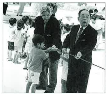
▲皆で力を合わせて掲揚しました