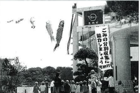
▲風にふかれて鯉のぼりも子ども達のように元気いっぱい

五月五日のこどもの日から十一日までの一週間は子ども達が健やかに育つことを願って児童福祉週間に制定されています。 村では、児童福祉週間を前にした四月二十三日、村立・私立の保育所園児が参加しての鯉のぼり掲揚式が役場玄関前で盛大に開催されました。