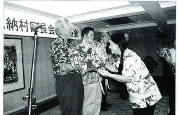
▲5月21日に開催された新旧区長歓迎会