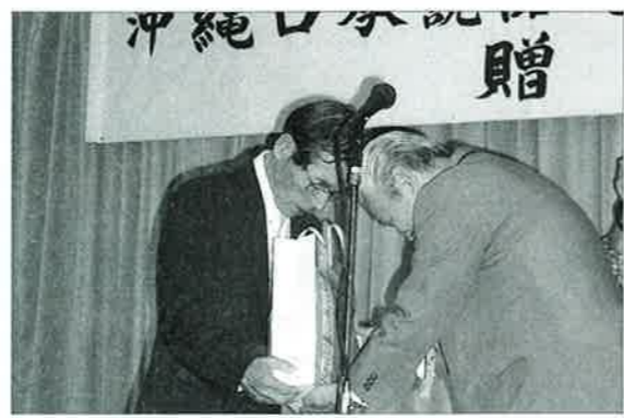
▲沖縄国際で行われた贈呈式