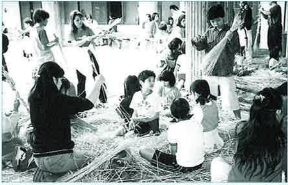
▲親子一緒になってのしめ縄作り