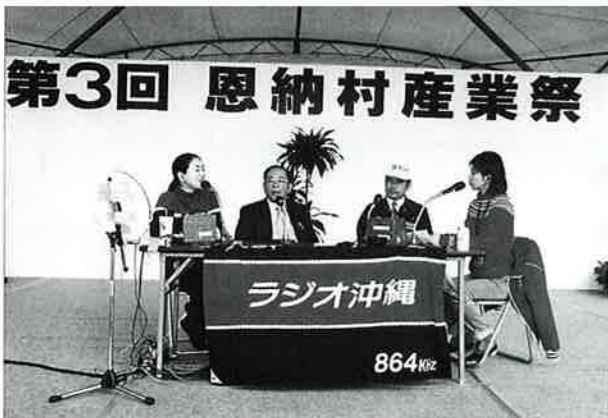
▲ラジオの公開放送も行われました