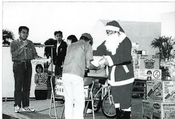
▲サンタから福引抽選の商品贈呈