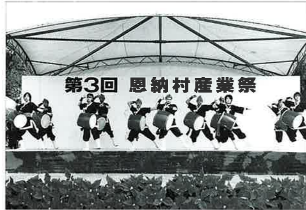
▲恒例となったかりゆし太鼓の演舞