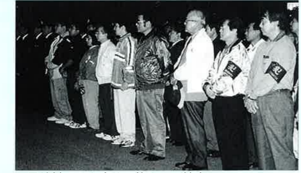
▲恩納村からも多くの皆さんが協力

年末に多発傾向にある強盗等の凶悪事件や悲惨な交通事故、青少年の深夜はいかい等を未然に防止するため、石川警察署・市町村・地区防犯協会の三者が協力し十二月十六日、石川地区内の防犯活動を実施しました。 石川警察署前で行われた出発式には、各機関から集まった関係者で会場一杯になり、石川警察署長から活動への協力者に対し感謝のことばと安全な活動実施への協力依頼がありました。 出発式後、各市町村毎に分かれて車や徒歩で街頭の防犯活動を展開しました。村では村青少年健全育成協議会とタイアップして、防犯及び青少年育成関係者が協力して村北部・南部の二班で村内を巡回し地域内の安全確保に努めました。