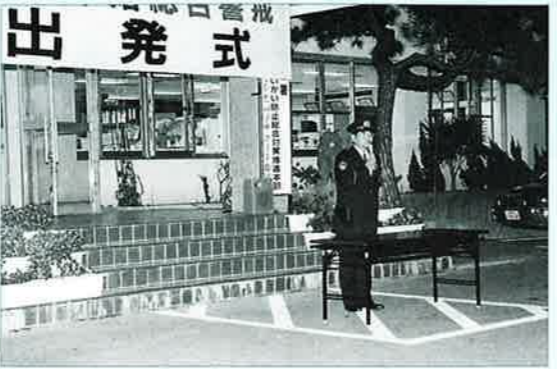
▲石川署当真署長が激励