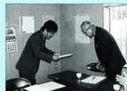
▲平成12年12月25日委嘱状交付式