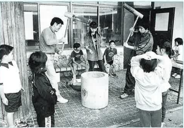
▲よいしょ よいしょ もちつき