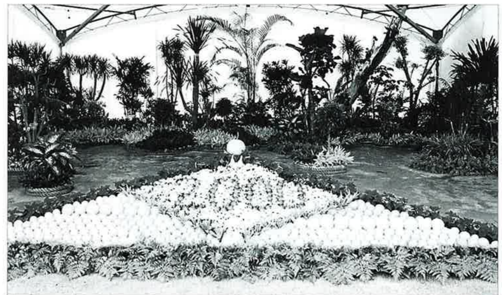
▲村内で生産された作物で飾り付け