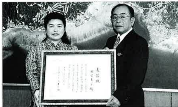
▲大城村長に受賞を報告