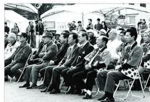
▲オープニングには多くの関係者が出席

恩納村が冬のまつりとして位置付け、平成十一年から開催している産業まつりが十二月二十三日から二十四日の二日間、村コミュニティ広場で開催され、これまでで最高の人手でにぎわいました。 産業まつりは、村内産業の振興の一環として、広く村内外に紹介し、村民、各生産者、観光関連事業所等の親睦と連携を図り、地域産業の発展に寄与することを目的に開催されています。 産業まつりのオープニングセレモニーでは、大城村長を含めた関係機関・団体の代表六名によるテープカ