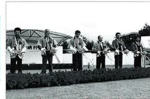
▲関係団体によるテープカット