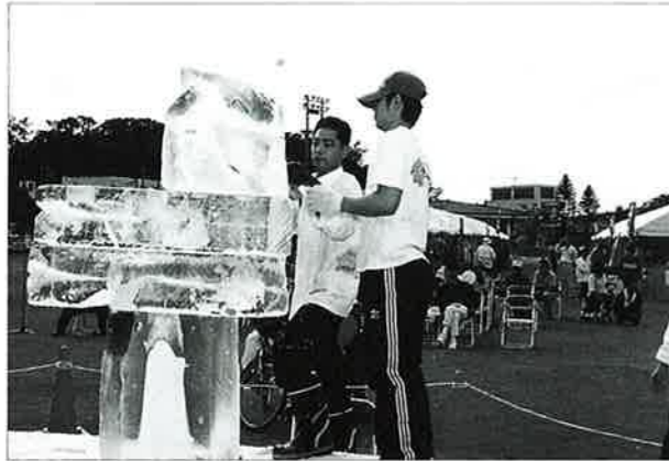
▲氷の彫刻も会場で披露