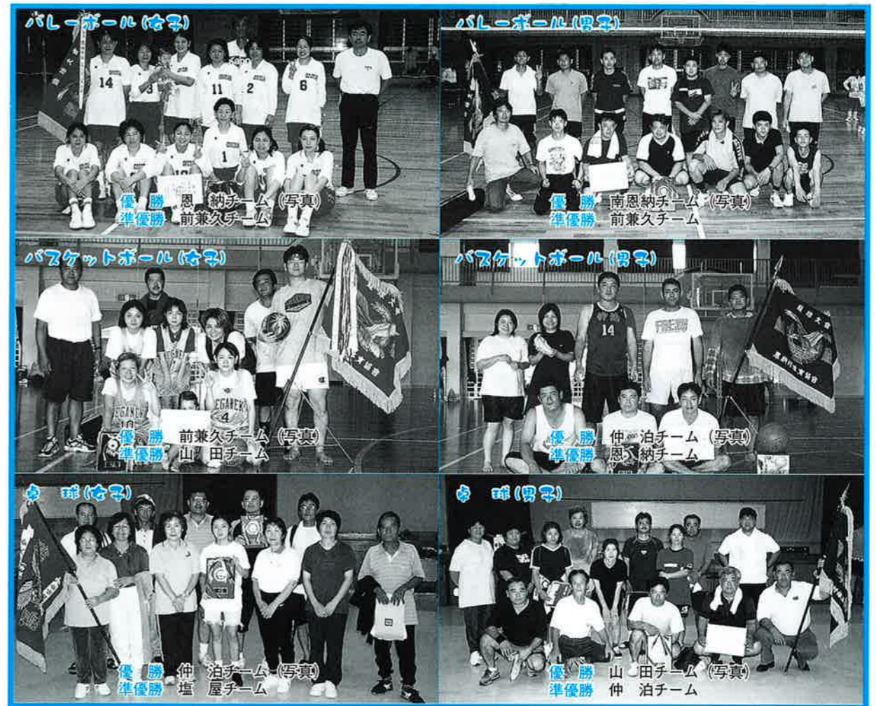
球技大会まで終えた体育大会の総合得点順位（上位10字）

また、バレーボール女子では、恩納区が大会24連覇の達成やバスケットボールでは、男子は仲泊が3連覇、女子は前兼久が2連覇を果たしました。