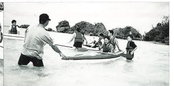
▲カヌーにも挑戦しました