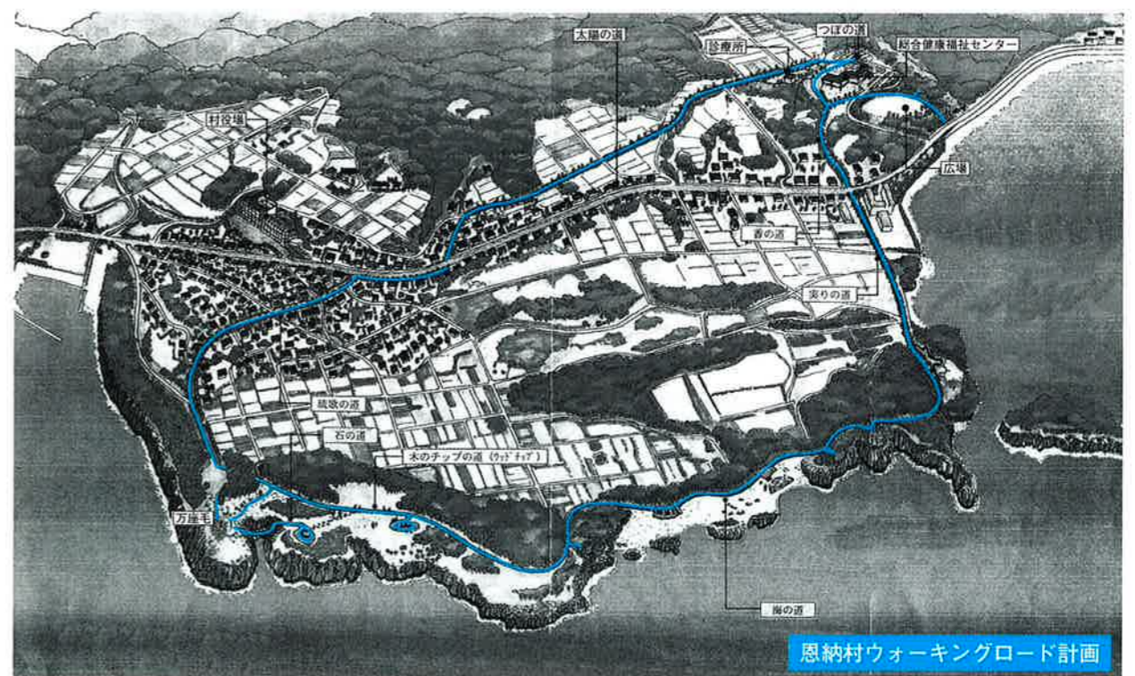
恩納村ウォーキングロード計画

健康ウォーキングロードは恩納村に多く点在する歴史遺産、文化、自然景観を現有的形態で、ふんだんに取り入れた、各集落の個性豊かな散策道とする。健康ウォーキングロードはエリアごとに北部、中部、南部の三地区に分け、村民全員で利用できるものとする。