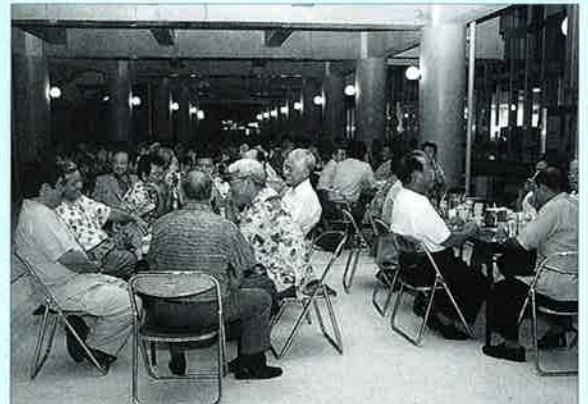
▲サミット無事終了を参加者で喜びました

会場では、参加者に牛汁も振る舞われ、村内の舞踊研究所の舞踊も会を盛り上げてくれました。ご協力いただきました皆様ありがとうございました。