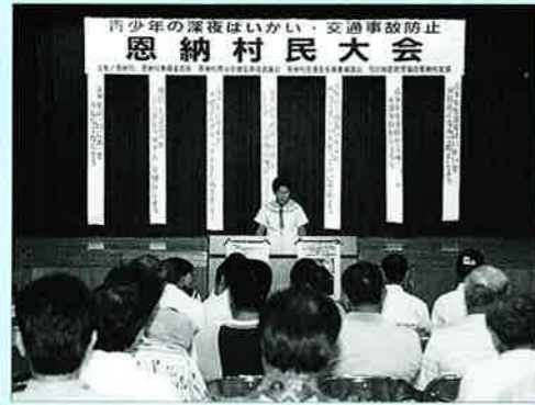
▲高校生代表による意見発表