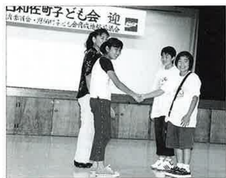
▲にっこりお願いしますと民泊引渡式

その日の晩、日和佐の子ども達は、村内各家庭に別れて民泊し、それぞれの家庭や地域でも温かく迎えられ、家庭料理を楽しみました。