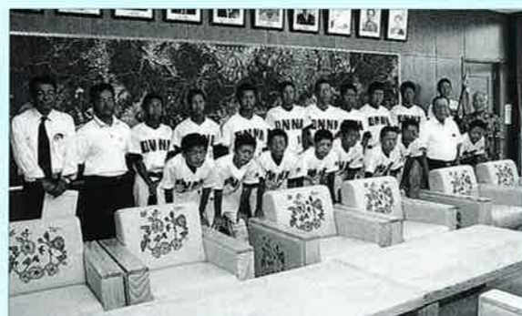
▲今後ますますのご活躍を期待します