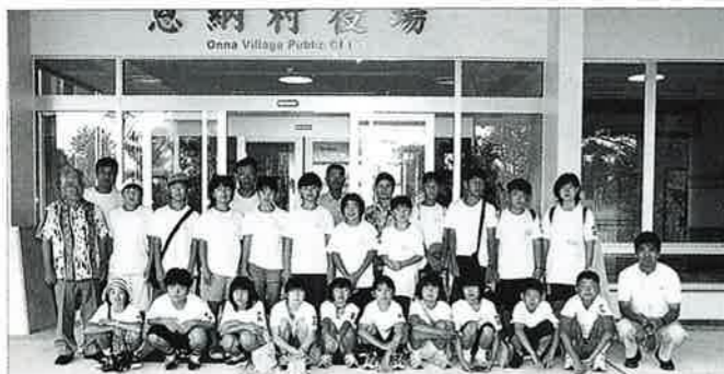
▲村役場新庁舎も見学に訪れました