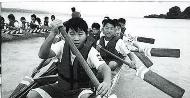
▲サバイバルではサバニにも挑戦