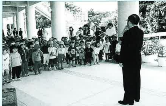
▲元気の園児を村長が激励