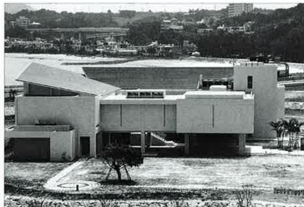
▲仲泊内海で開館準備の博物館