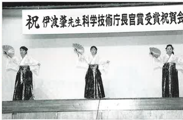
▲真栄田区の婦人會も舞踊で祝う