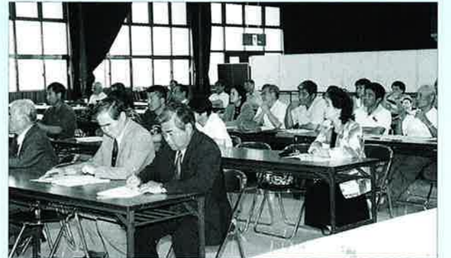
▲会場には社会教育関係者が出席