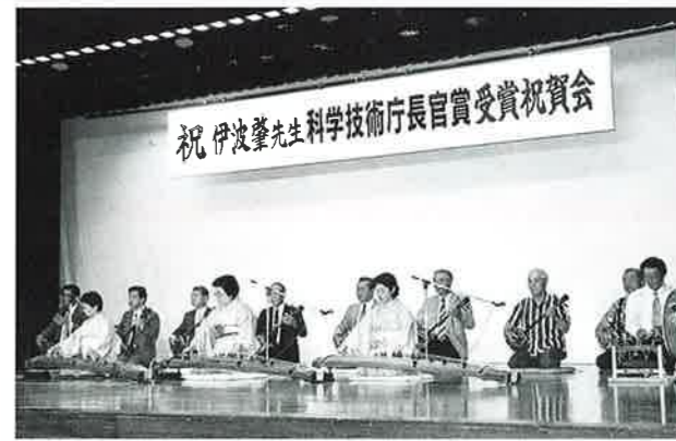
▲村文化協會も古典音楽演奏で祝う