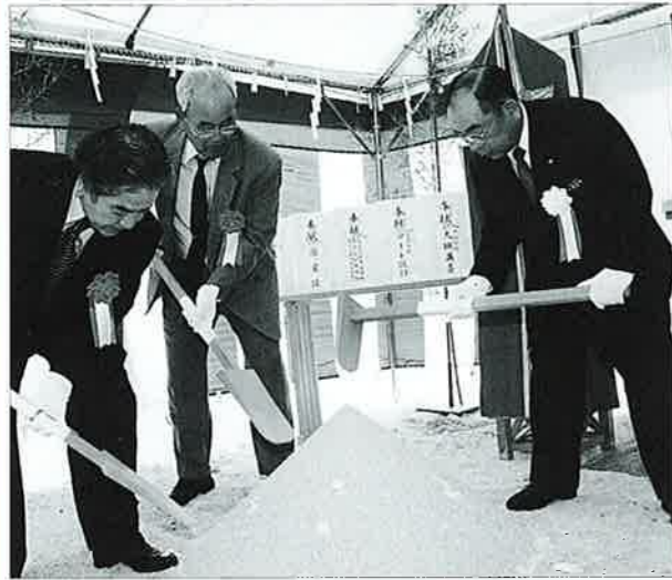
▲大城村長と工事関係者による鍬入れ

同団地は、入居予定が12世帯で工事がスタートし平成12年12月の完成と平成13年2月入居を予定しております。