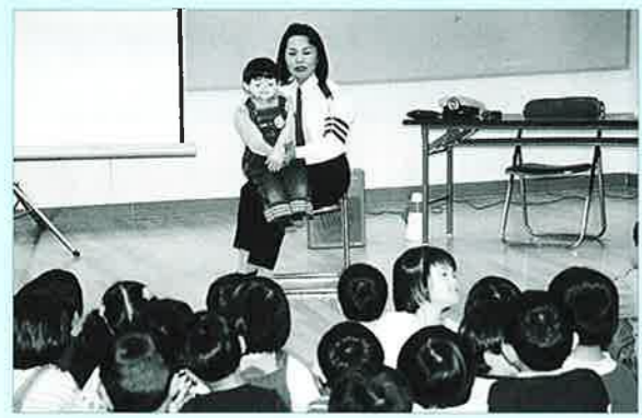
▲交通事故防止を父母も含めて学習