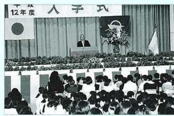
▲恩納校体育館で行れた入学式