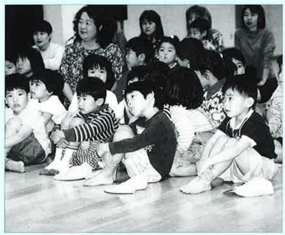
▲交通安全教室に参加した子ども達