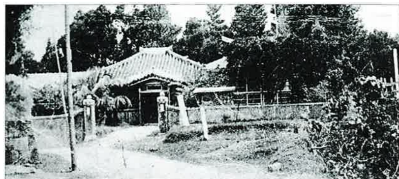
▲現在の恩納診療所にあった頃の庁舎