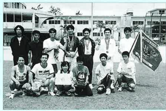
▲見事優勝に塩屋Aチーム