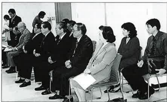
▲各学校の校長とも同席