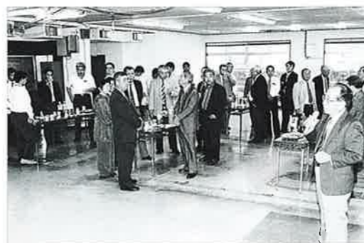
▲旧庁舎での思い出を話す大城元村長

は担当課長から四月一日からの事務スタートについて職員の協力を呼び掛けていました。 新庁舎では、三月二十七日の落成式典から二十八日、二十九日の村民へのお披露目を終えた三十日頃から各課の移動がはじまり、四月一日の土曜日には、職員、議員、区長会、村建設業者会等の合わせて約二百名近くが協力して新庁舎への移動を行い、四月三日の行政サービスの開始ができました。 ご協力いただきました皆様本当にありがとうございました。