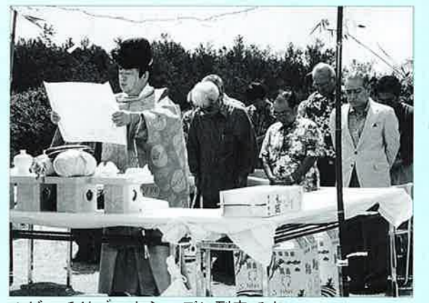
▲ビーチリゾートシーズン到来です

岸線は国定公園にも指定され、天然のすばらしいビーチを目的に観光客が年間二百四十万人以上も訪れる沖縄観光の代表的な地域になっており、村ではシーズン到来を前に海難事故防止を村並びに関係者で祈願しようと計画されました。 海上には、観光関連事業所の所有する船舶も参加し陸上と一緒に海上からも海難事故防止を共に願いました。