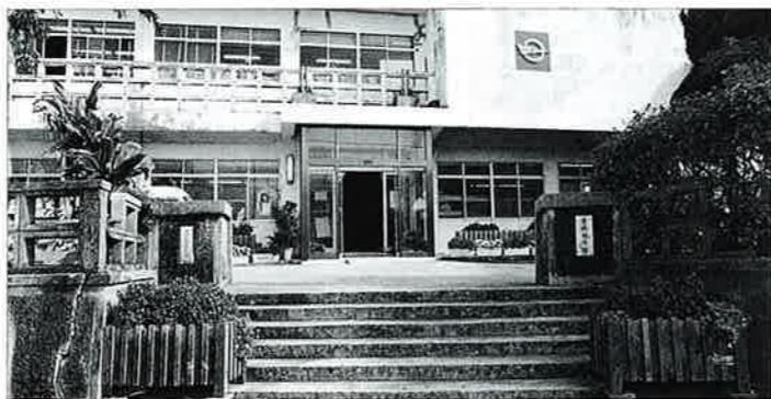
▲鉄筋コンクリート二階建の前庁舎