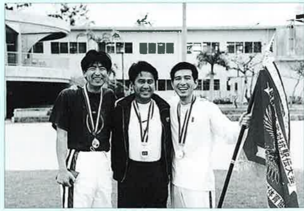
▲区間賞に輝いた3名も優勝にニコリ