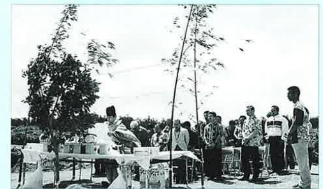
▲万座毛で参加者全員で海の安全を願う