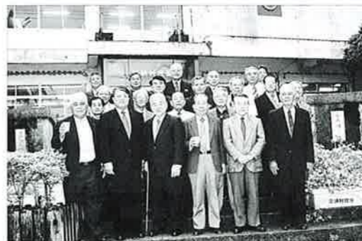
▲旧庁舎をバックにOBらは記念撮影

昭和三十三年に木造瓦葺きから鉄筋コンクリート二階建に改築され、これまでに増改築や補修を繰り返し替えし、平成十一年度いっぱい行政サービスの提供を終了した村旧庁舎で職員や職員OBが参加して旧庁舎で閉庁式が行なわれました。