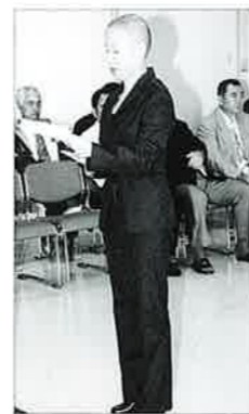
▲4月10日に行われた新規採用辞令交付式