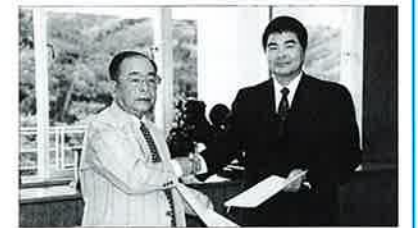
4月25日に協定書締結(村長室) ▲