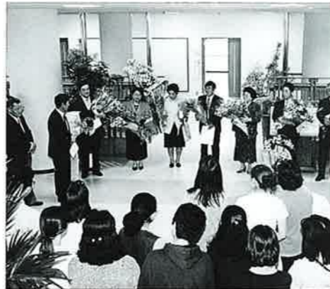
▲職員らから多くの花束が贈られました