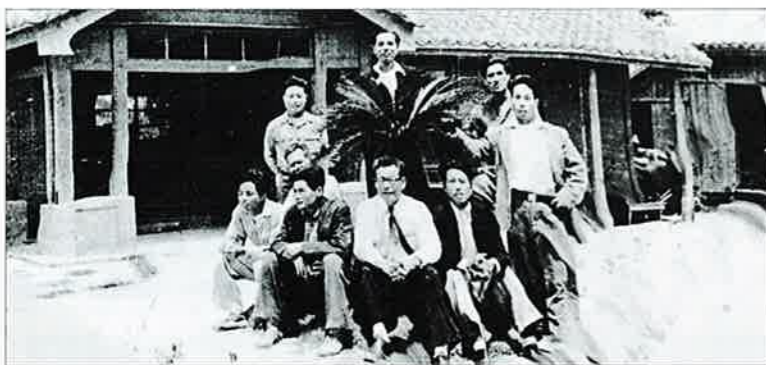
▲1954年頃の木造瓦葺きの庁舎