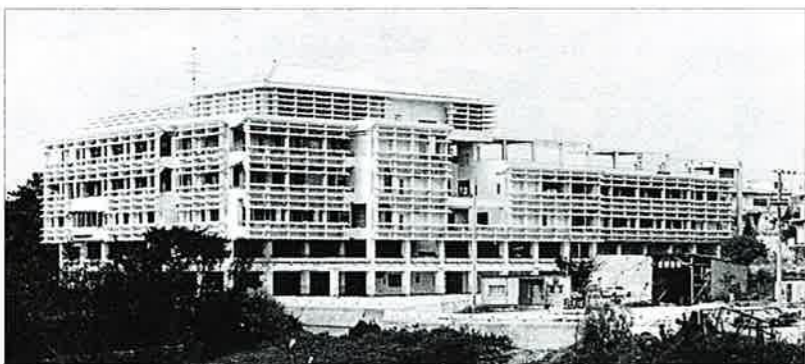
▲2月29日に竣工し、4月3日から行政サービスの始まった新庁舎

庁舎の増改築工事竣工落成（分散していた課・教育委員会・議会等・集会場を一棟に納める）総延べ面積六五九坪