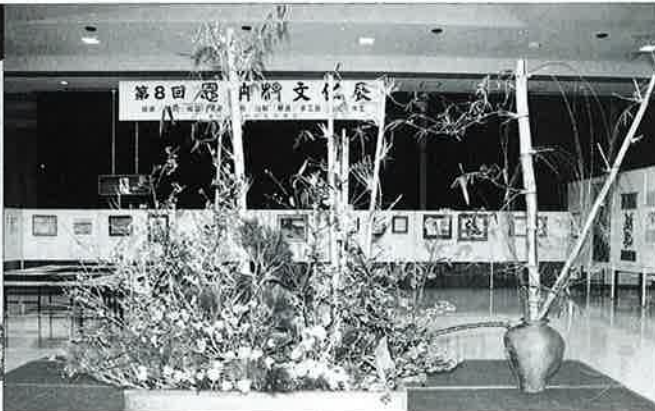
▲会場で人目を引いた華道の合作