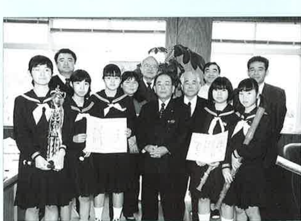
▲全国大会での活躍を期待しますと村長激励

奏したチームにきまり、三月二十八日に東京で開かれる全国大会への二年連続出場が決まりました。