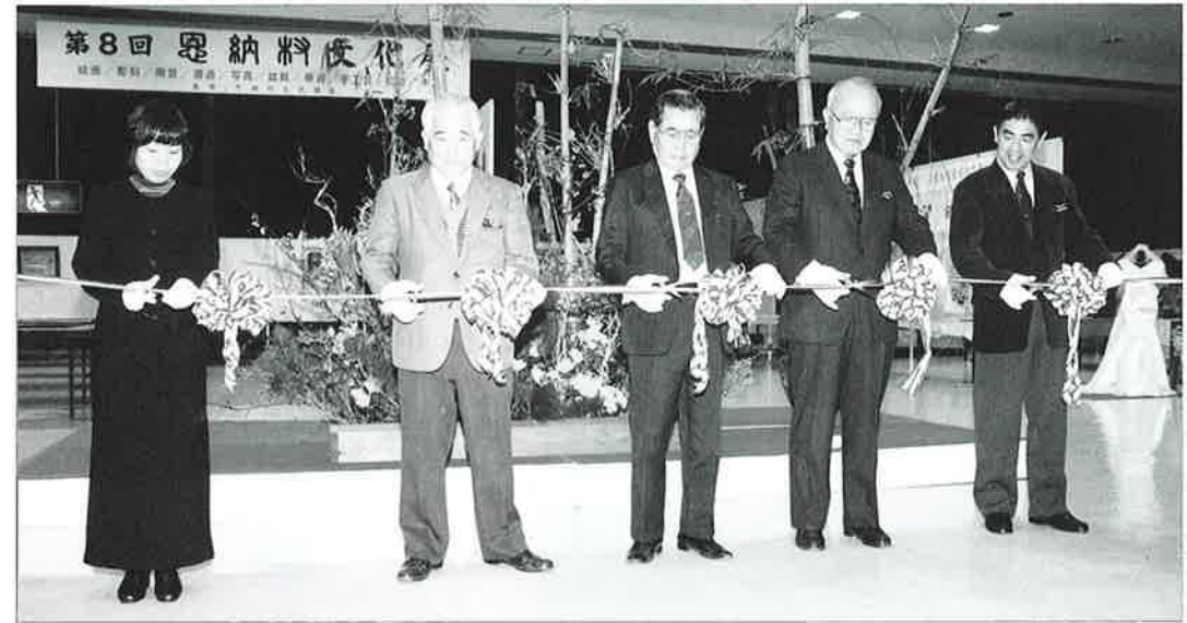
▲2月18日に行われた関係者によるオープニングテープカット