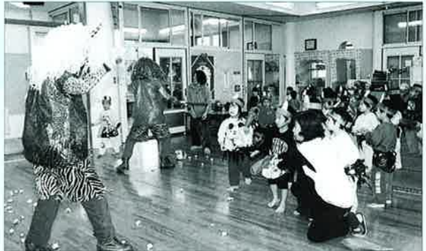
▲元気な園児が協力して豆まき