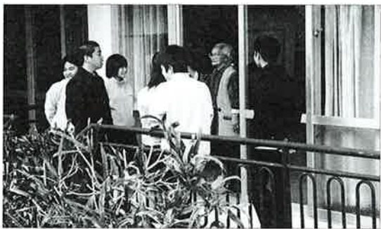
▲地元生徒が訪問しプレゼント

山田中学校生徒会では、区内で一人暮らしの老人らに三学期に入って生徒や職員らの協力で種から大切に育ててきたインパチの花を二月中旬から下旬にかけてプレゼントしました。 同校では、これまでに一人暮らしの老人に敬老の日のお祝いの葉書や年賀状を贈っており、今回の花のプレゼントは同じ地域内に住む生徒達が生徒指導の担当教諭と一緒に、校区内の区長さんにも協力していただき、これまで大事に育ててきた花を放課後を利用して届けました。 生徒指導の担当教諭は、地元で一人暮らしの方々との交流できるいい機会になりますと話していました。また、花を届ける際には恥ずかしが