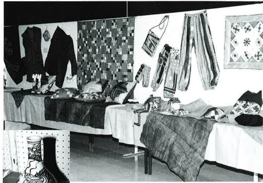
▲手工芸の部の展示