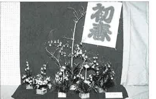
▲初春を祝う華道の展示