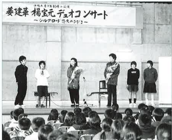
▲小中の代表がそれぞれお礼を述べました

「シルクロード悠久の響き」と題した公演では、二胡と中国琵琶の軽快な音楽からはじまり、演奏の合間に使用する楽器の説明や子どもの頃の話もありました。