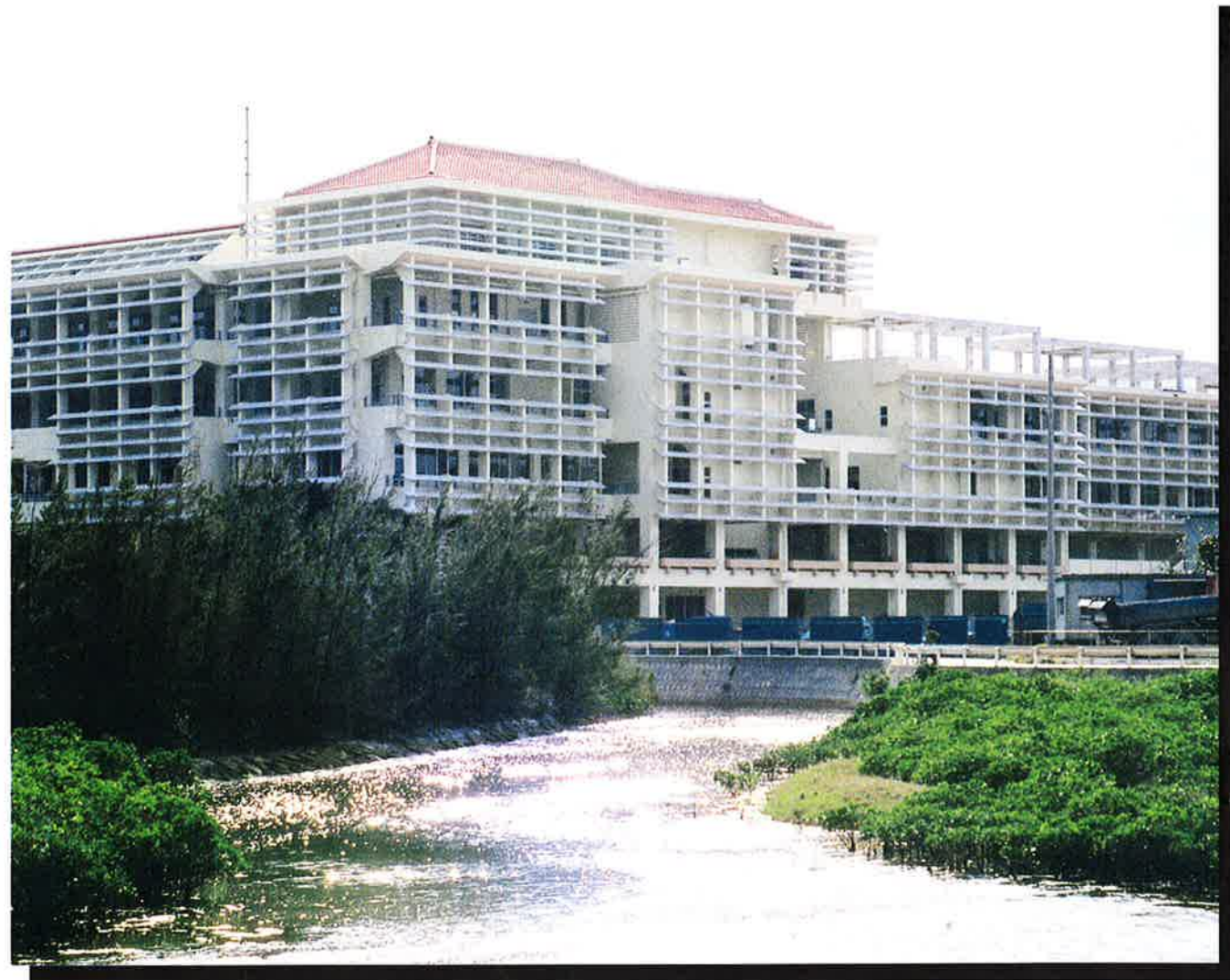
各課配置と電話番号はP2・P3