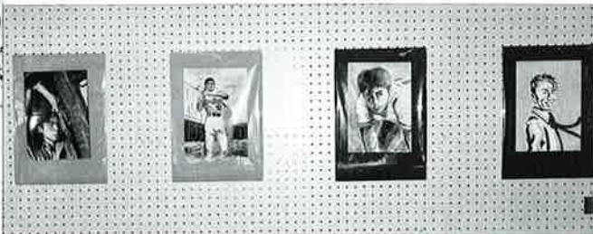
▲特別展示の眞嗣朗さんの作品