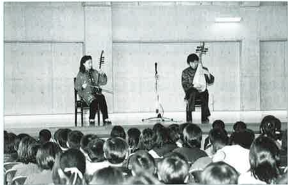
▲全校生徒が二胡と中国琵琶の公演