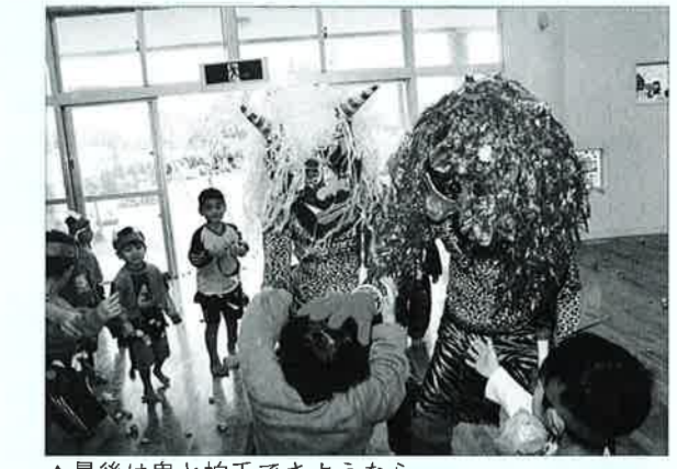
▲最後は鬼と拍手でさようなら

鬼が園舎の中に入ると、これまで威勢よく豆を投げていた子どもも一斉に逃げ出し、先生のうしろや押し入れの中、また小さい子は机の下等で声をひそめ隠れていました。鬼に見つかつた途端大声で泣きだす子どももいました。