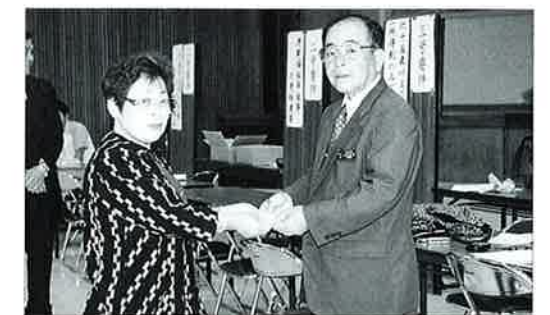
▲平成11年3月25日交付日初日 (コミュニティセンター)