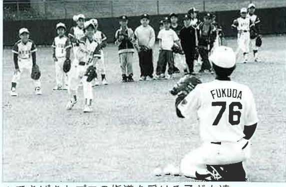
▲てきばきとプロの指導を受ける子ども達

読谷村でキャンプ中の中日ドラゴンズの二軍監督やコーチらの指導による少年野球教室が二月十三日、キャンプ地の読谷村営野球場で開催され、村内の五つの少年野球チームが参加しプロの直接指導を受けました。