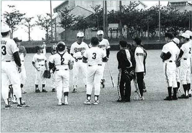
▲これからは頑張ってくださいとプロから激励

プロの指導を受けるとあって教室には、五チームから参加の子ども達がてきばきした動作や大声を出し、楽しみながら汗を流していました。また、指導したコーチ等からは、これからは野球をどんどん楽しんでもっと上手になれるようこれからも頑張ってください。と激励もありました。