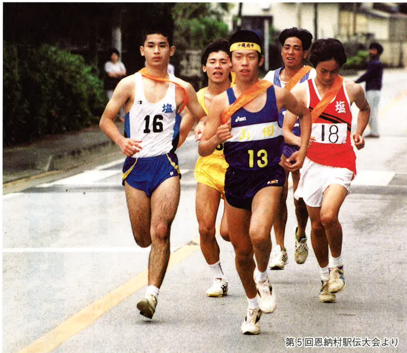
第5回恩納村駅伝大会より