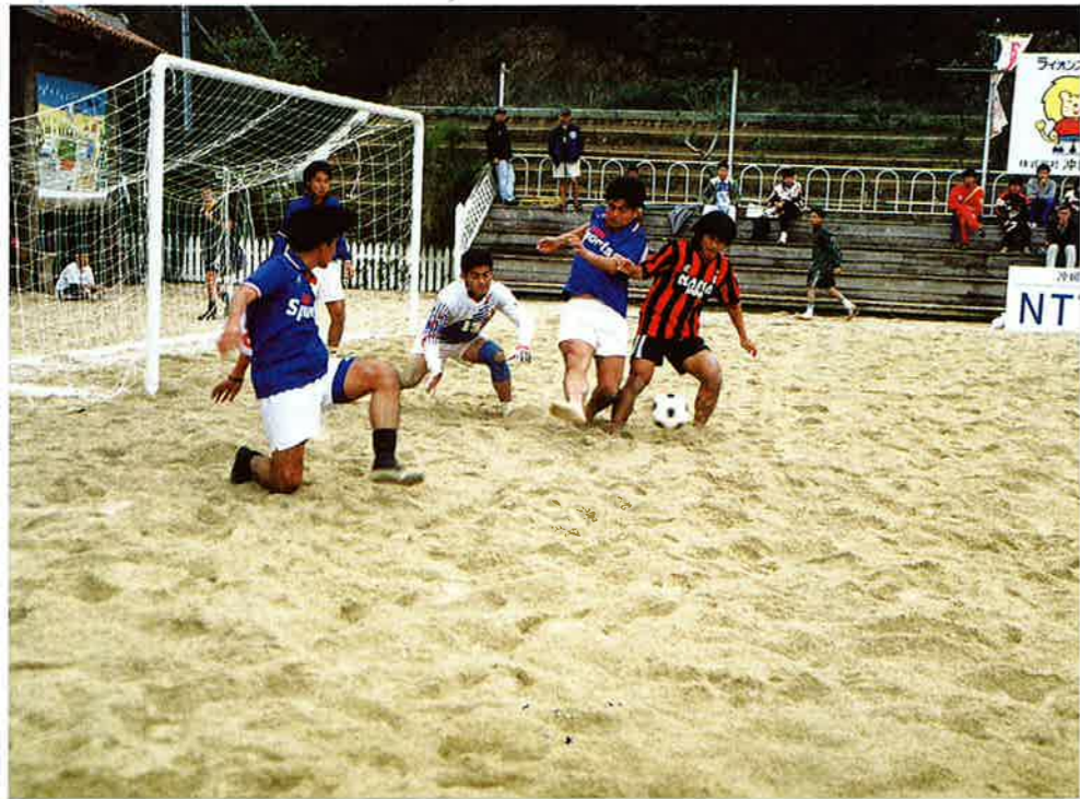
▲チャンピオンクラス決勝より

第二回恩納村長カップビーチサッカーinオキナワ(主催 恩納村)が四月五日(土)、六(日)村内の各ビーチで一〇六チームが参加し、三クラスの部で行われました。