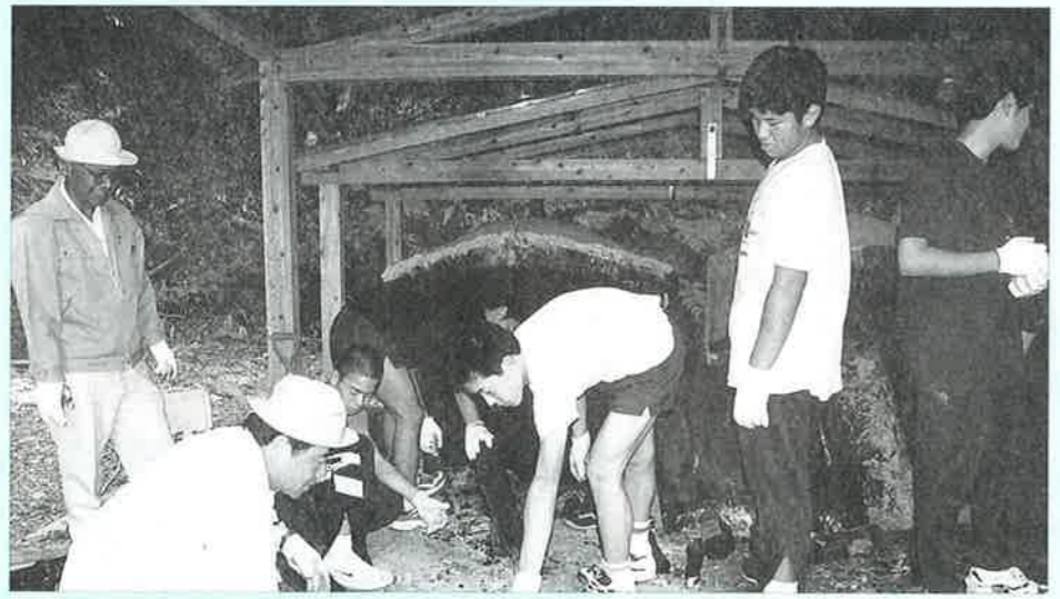
▲できあがった炭を取り出す。