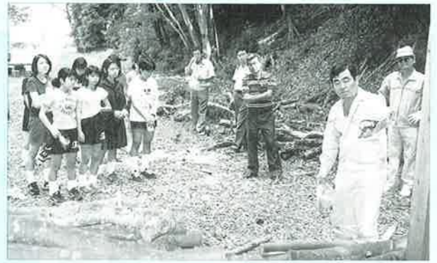
▲炭作りの前に説明を受ける生徒達

▲炭作りの前に説明を受ける生徒達 安富祖小中校(新城和市長)中学三年十八人は、野外体験学習の一環として、四月二十一日(月)に沖縄県農林水産部林務課、村経済観光課の協力により県民の森で炭作りを行いました。 県林務課職員による、炭作りの県内生産の現状、炭作りの手順等説明があり、どの生徒も炭作りは初めてで、真剣な表情で 説明をきいていました。その後、さつそく炭作りに入り、窯へ約三百キロの生木を慎重に詰めていきました。五十五時間かけて焼かれた炭は当初の予定よりは少なくなりましたが、生徒達は「自分たちで作った炭で七月に行う野外研修のバーベキューに使用したい」と話していました。