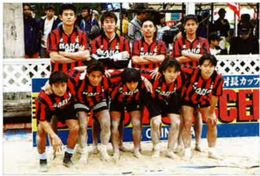
▲チャンピオンクラス優勝 FCふじまつ