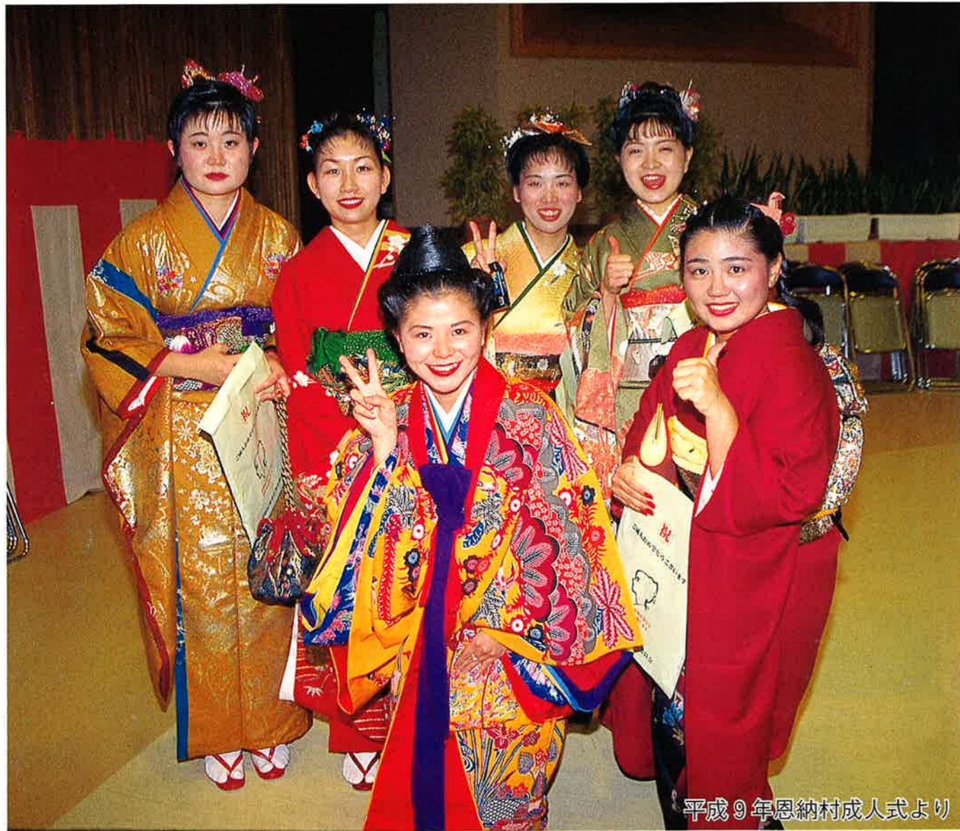
平成9年恩納村成人式より