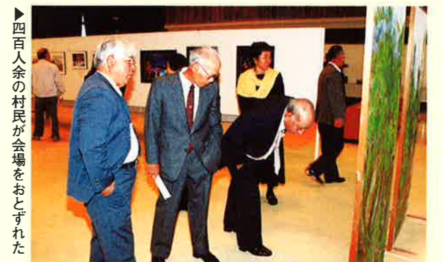
▶四百人余の村民が会場をおとずれた