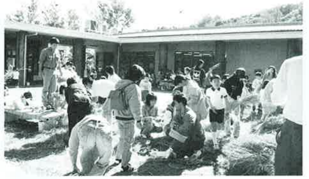
▲正月のしめ縄づくりも行われた

第15回の恩納村子どもフェス ティバルが12月22日、コミュ ニティセンターで行われまし た。子ども会のメンバーやジュ ニアリーダー、育成者など約三 百人余が参加しました。 舞台では、サバイバルキャン プや県外交流などの体験発表が 行われました。続いて 各子ども会が楽しい劇や舞踊を 披露しお互いの活動の成果に拍 手を送りました。 野外では、しめ縄作りや餅つ きドッチボール大会が行われ、 会場周辺は子どもたちの歓声に 包まれていました。 この催しは、今年一年の子ど も会活動の締めくくり。参加し た子ども会のメンバーは今後の 充実した活動を誓い合いまし た。