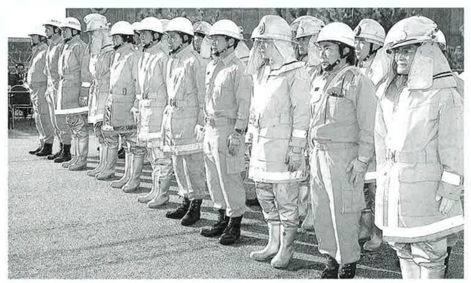
▲村民の生命財産を守る消防職員の皆さん

金地区消防本部、金地区消防 団の出初め式が1月7日、本部 前駐車場で行われ、本部職員と 団員約80人が勢ぞろいして今年 一年の無事故、無火災と消防活 動の充実を誓い合いました。 服装点検や機械器具点検の 後、消防職員らによる展示訓練 が行われました。消防車を使っ ての消火活動やハンゴ車による 救助活動が本番さながらに行わ れました。 アトラクションで幼年消防ク ラブの皆さんのかわいらしい遊 戯も披露され、会場の雰囲気 を和らげていました。 なお、本村における平成8年 の火災発生状況は6件が発生。 救急出動件数は451件で、一 日平均1.2回の出動となっていま す。