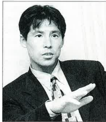
アトランタ五輪・サッカー日本代表監督 西野 朗

わたしが育った埼玉県浦和市は「サッカーのまち」。小学一年生のころからサッカーに熱中したわたしは、小学校を卒業するときの作文集に、「将来は一流のサッカー選手になりたい」、そう書きました。随分大それたことを言ったと思いますが、あの少年の日に描いた夢は、それから片時も胸を離れませんでした。高校時代に、そんな思いはますます強くなり、早稲田大学に入ってその夢を実現したいと考え