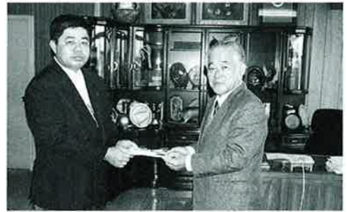
▲(株)大京からは毎年多くの善意が寄せられています