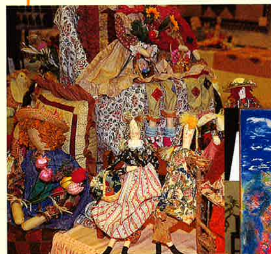
▲手芸の部には88点の作品が出展