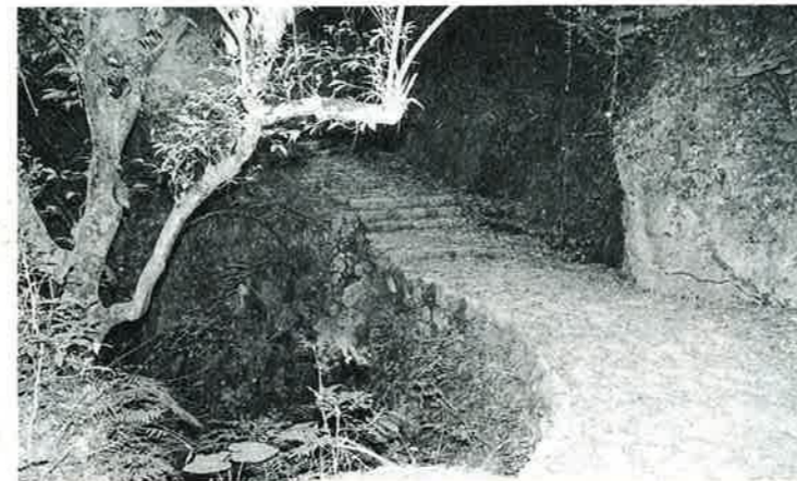
▲山田から久良波へぬける 歴史の道「国頭方西海道」

谷茶前と並んで有名な民謡、「クラハヤマダ」は、久良波山田ぬ 美ら祝女ぐわー 世間音高さ ウチファイファイ…と歌う。恩納村の歌としては忘れてはならない一曲である。