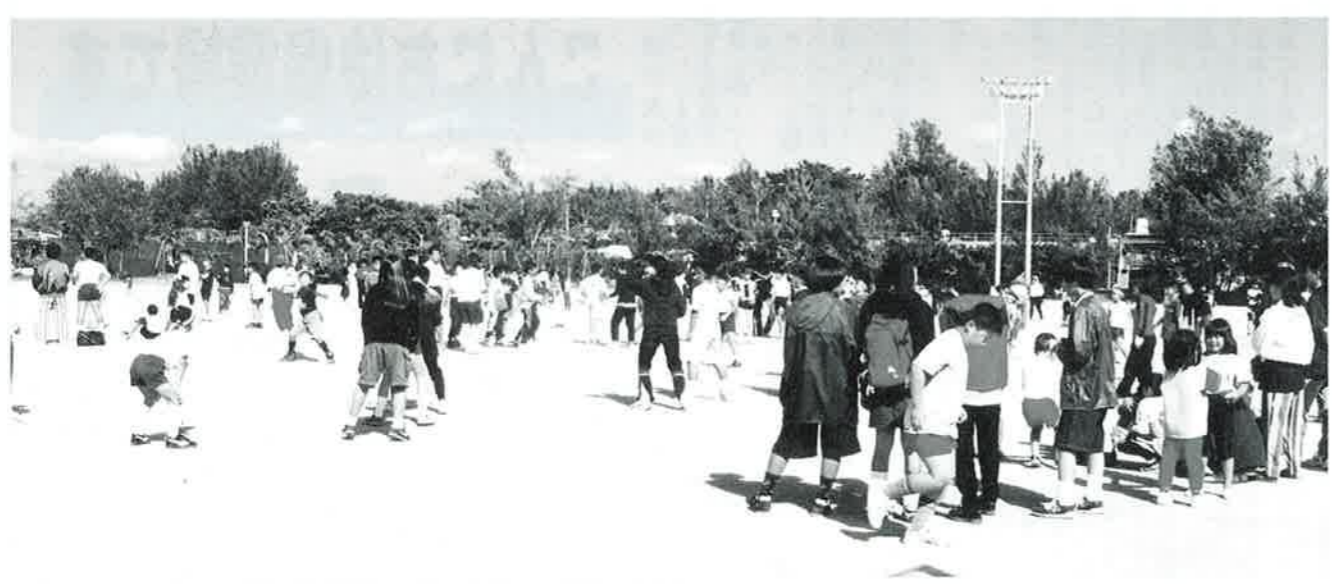
▲舞台発表のほかドッチボールで交流を深めた