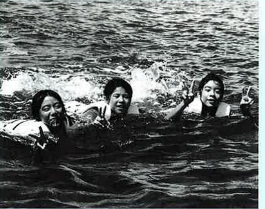
▲最大の難関は3キロの遠泳