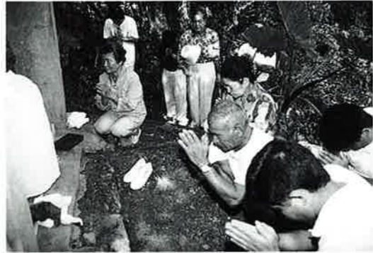
▲村人の健康を願う重要なものでした