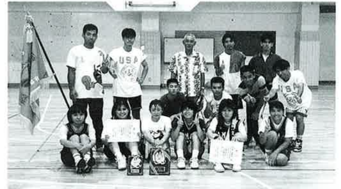
▶バスケット女子優勝、男子準優勝の山田区チーム