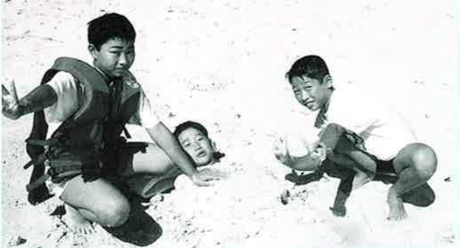
▲真っ白な砂浜に感激