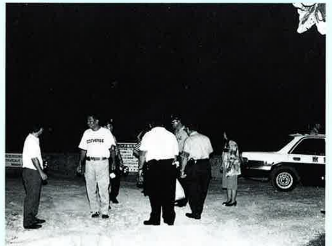
▲「きたときよりきれいに」が基本です

石川警察署と防犯協会恩納村支部では八月十二日、富着区の海浜の利用者に「美しい海浜を楽しく」とかかれたチラシを配布して正しい海浜の利用を呼びかけました。 恩納村の美しい海岸線は、夏場にもなると多くのキャンプ客でにぎわいをみせます。 ここ富着区では利用者のカラオケや爆竹の爆音、国道への違法駐車など地域住民の生活環境に悪い影響を及ぼしています。 午後八時すぎから行われたチラシ配布には地元の知花区長も参加、「地域住民への配慮をお願いいたします。」と利用者へ呼びかけていました。