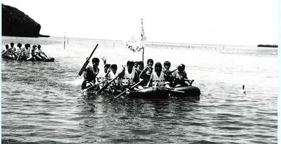
▲イカダで無事到着、サバイバルもこれで終了