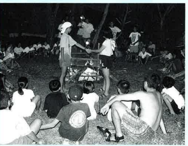
▲キャンプファイヤーを囲んで楽しい交流会

恩納村と徳島県の日和佐町の子ども達の相互訪問。今年の日和佐町から二〇人の子ども達が八月二十日から三泊四日の日程で恩納村を訪れ村内の子ども達と交流を深めました。 初日、沖縄県を代表する景勝地の万座毛に立ち寄った子ども達は、コバルトブルーの美しい海に感動をかくしきれない様子でした。その日は一般家庭での宿泊、沖縄の家庭料理に舌鼓を打ちました。 二日目はヨ一島でのサバイバルキャンプに合流、シュノーケリングや釣りを楽しみました。夜にはキャンプファイヤーを囲んでの交流会が行われました。