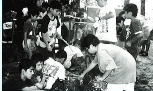
▲食事の準備、材料の調達、マキの確保まで自分たちで

日常の文化生活では触れることのできない大自然の営みや美しさ、厳しさを体で感じながら団体生活のルールを学ぶサバイバルキャンプ(主催・教育委員会、子供育成連絡協議会)が、八月二十三日から三泊四日の日程でヨ一島で行われました。 初日、五〇人の子ども達はお父さん、お母さんに見送られ元気に南恩納の船着き場を出発しました。 島ではさつそく三隻のハーリー船に乗り込み元氣よく島を一周しました。 夜は安富祖のたんぼで自分たちで植えつけ刈取りした米を使つての野外炊飯、子ども達は収穫の喜びをかみしめました。 その他キャンプでは、昔ながらの追込み漁や三キロの遠泳なども行われました。