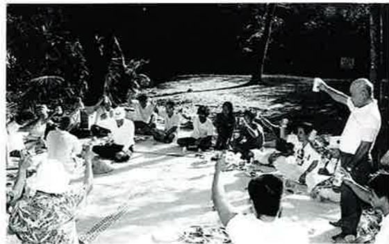
▲今も昔も変わらぬ幸福への願い

旧六月二十五日の六月ウマチー。恩納区と南恩納区には屋嘉田潟原に浮かぶヨー島に挿する年中行事が残っています。 字のお年寄りがノロ殿内を出発し、途中、南恩納区の皆さんも加わりヨー島に渡り拝所にお酒や刺し身を供え豊作と豊漁を祈願します。 屋嘉田潟原を横切って、谷茶野原（通信隊跡周辺）に渡航耕作していたことから、以前は谷茶からも魚が