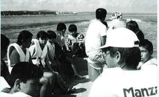
▲無人島へ出発、サバイバルのはじまり