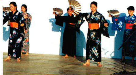
▲女子役員による「かぎやで風」