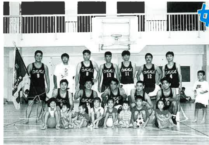
▲バスケット男子優勝の恩納区チーム

バレーボール女子では恩納区が二十一連覇、卓球競技では仲泊区が九連覇の偉業を成し遂げました。