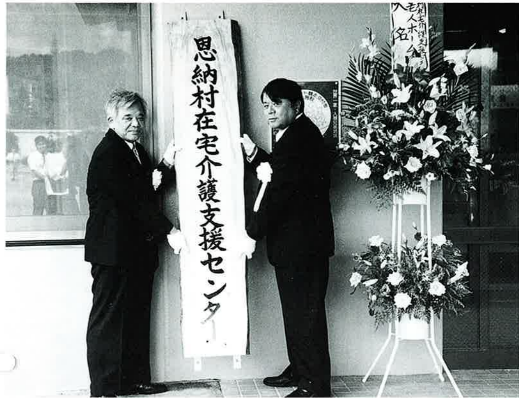
▲村民のみなさん、気軽に利用して下さい

地域で家族と暮らすお年寄りの保健福祉サービスの充実を図ろうと開所準備がすすめられていた「恩納村在宅介護支援センター」が8月1日から事業を開始しました。 この「支援センター」では、今後、増加すると予想される在宅介護・医療に関する様々な悩みが、24時間体制で直接あるいは電話で相談に応じます。 特別養護老人ホーム谷茶の丘デイサービスセンター一角にあり介護機器の紹介、様々な福祉サービスの申請のお手伝いなど在宅福祉サービスの総合窓口としてご利用できます。 急速な高齢化の進行や家族形態の変化等により、お年寄りの福祉ニーズも拡大・多様化しています。 恩納村では、平成5年度に在宅福祉を基本理念とした「老人保健福祉計画」を策定しました。お年寄りができるかぎり住み慣れた地域で生活が営めるように、「デイサービス事業」をはじめ、今回の「在宅介護支援センター」の開所など在宅における保健福祉サービスの充実をすすめています。