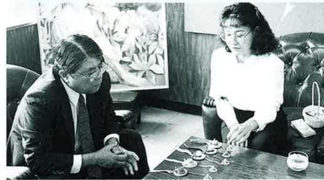
▲帽子の中には厄よけの塩が入っています

交通安全を呼びかけました。 母の会のメンバーからお守りを手渡されたドライバーは、笑顔で答えていました。 また、「交通三悪追放」の標語入りチラシもいっしょに手渡れ交通事故防止を訴えました。