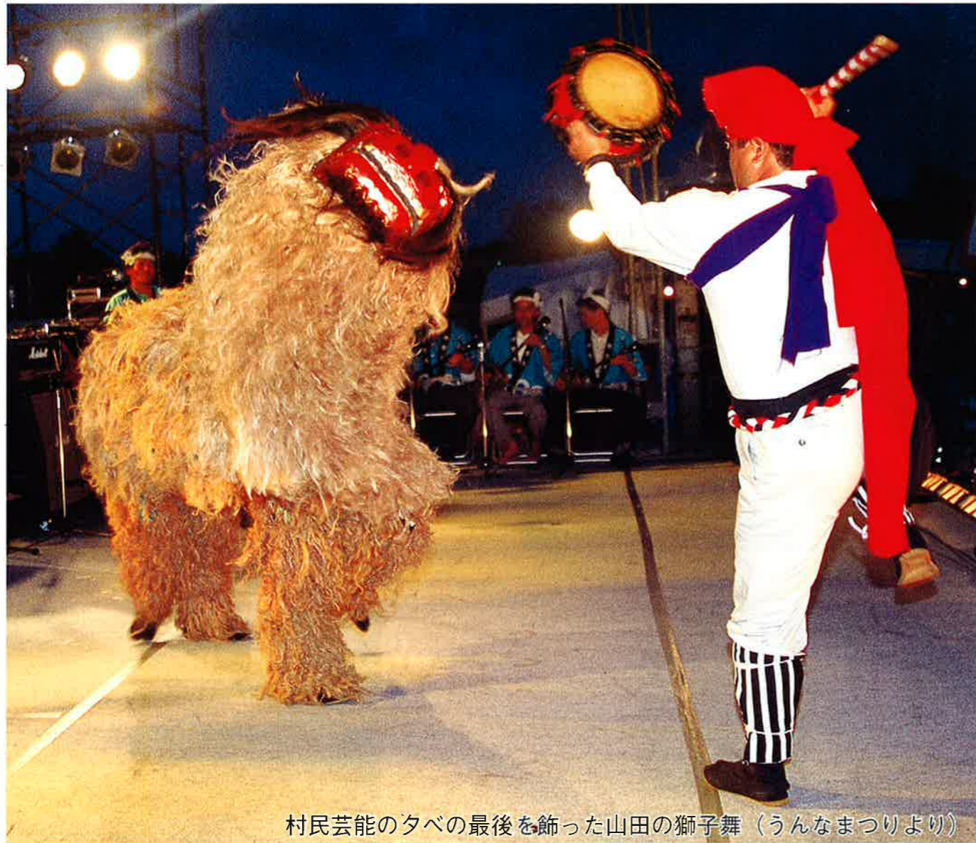
村民芸能の夕べの最後を飾った山田の獅子舞（うんなまつりより）