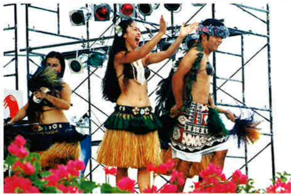
▲ポリネシアンダンスは観客も飛び入り参加

殺風景な護岸もマメ芸術家の手でお色直し。まつり会場を一段と華やかにしていました。