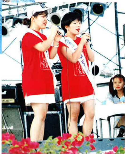
▶岡山県加茂川町のうれごろ小町のお二人さん。

まつりの呼び物のひとつ「魚のつかみどり」には多くのちびっ子が挑戦。まつりのフィナーレは人気バンド「ダイヤモンド」のステージ。最高の盛り上がりを見せていました。