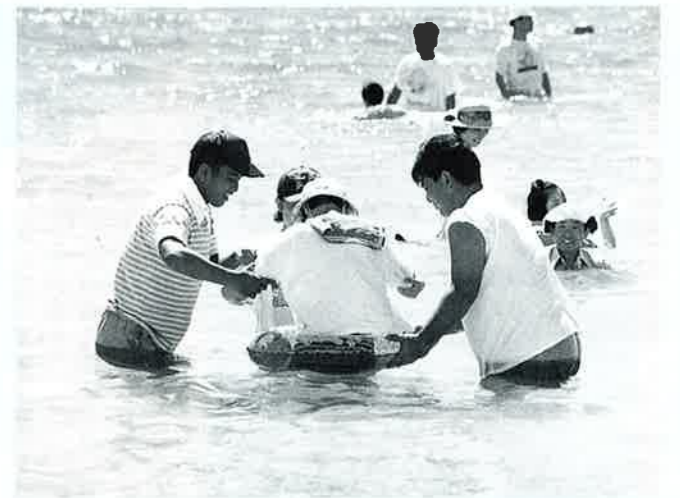
▲今年も楽しい思い出ができました

五名のボランティアも参加し、一人ひとり手をとり海水浴のお手伝いをしました。 この一行が沖縄を訪れるのは今年で十六回目で、これまでに約七〇〇人の障害者の方々が参加、ボランティアとの温かい交流の中で楽しい思い出をつくっています。