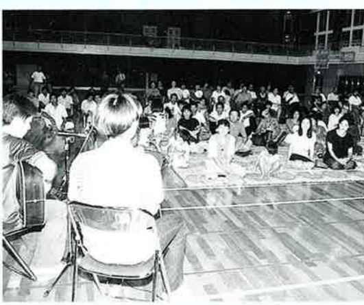
▲ナミヒラーズの歌にききいる参加者