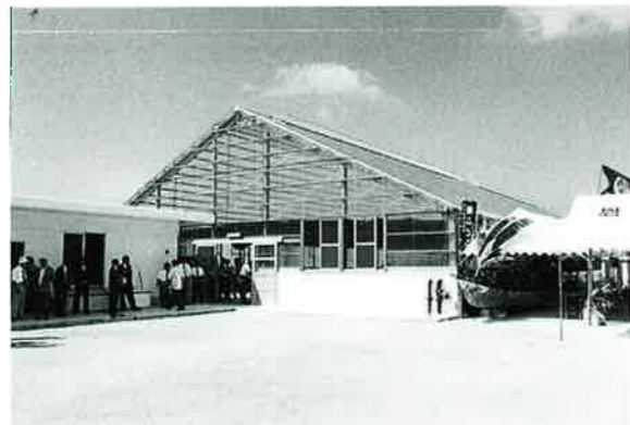
▲取り組みから8年間で養殖技術を確立