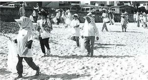
▲富着区民の皆さん

「海の日」の制定を記念してビーチウォーク&クリーンアップ大作戦が、地域住民をはじめ村内外のボランティア一、七九九人が参加して村内の海岸で行われました。週末となればビーチパーティーの行楽客でにぎわう富着ビーチでは、この日午前九時から出発式。その後、多くの区民が参加して砂浜や国道沿いの空き缶や紙くずの回収を行いました。 そのほか、村内四〇キロにおよぶ海岸線では一斉に清掃が行われました。 この日回収されたゴミは、燃えるゴミ、燃えないゴミを含めて五トン。ゴミ袋にして約一、四〇〇袋分のゴミの山が回収されました。