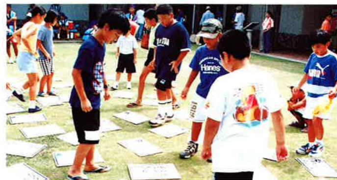
▲「琉歌の里」らしく琉歌による百人一首