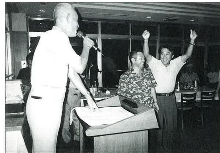
▲上位入賞におもわずガッツポーズ