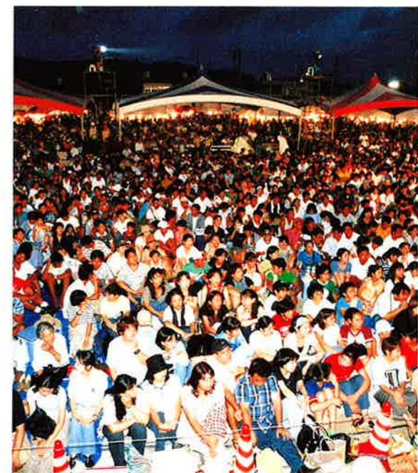
▲会場をあふれんばかりの観客