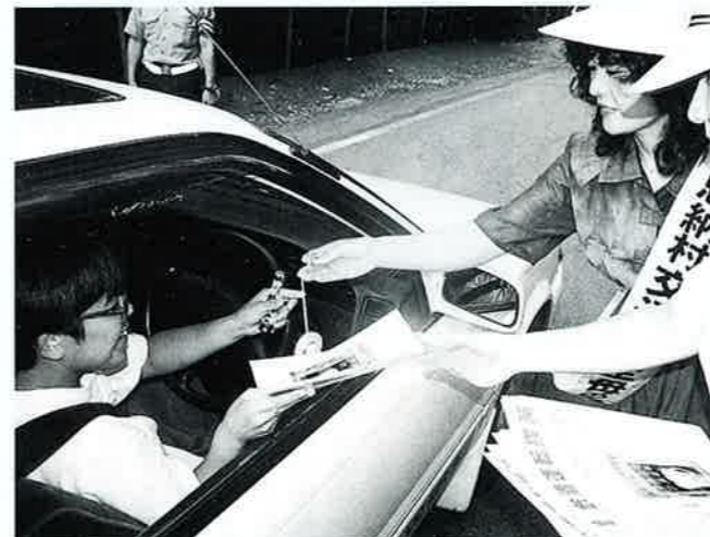
▲安全運転をお願いします