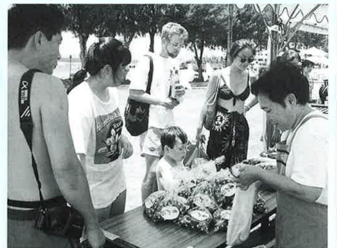
▲海ぶどうをめずらしそうに試食していました

た。海ぶどうやモズク、アーサ の加工品、マンゴーなどの農作 物を知人へのお土産にと多くの 観光客が買い求めていました。 試食コーナーでは泡盛万座や ゴーヤージュースを美味しくそ うに飲みほす姿も見られました。