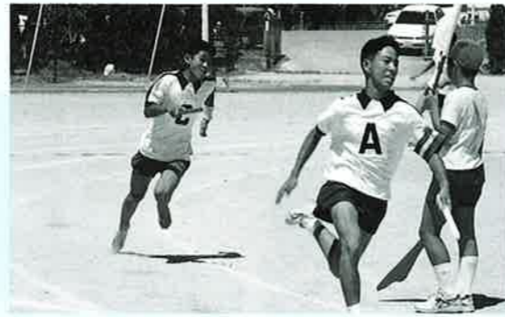
▲真夏の暑さも何のその