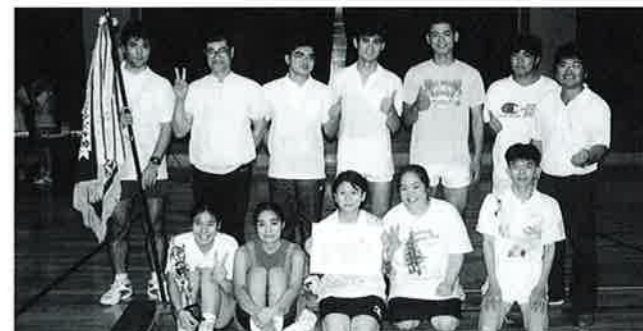
▲安富祖区チームのみなさん

『ツール・ド・おきなわ』実行委員会 TEL 0980-54-3174 FAX 0980-54-3169