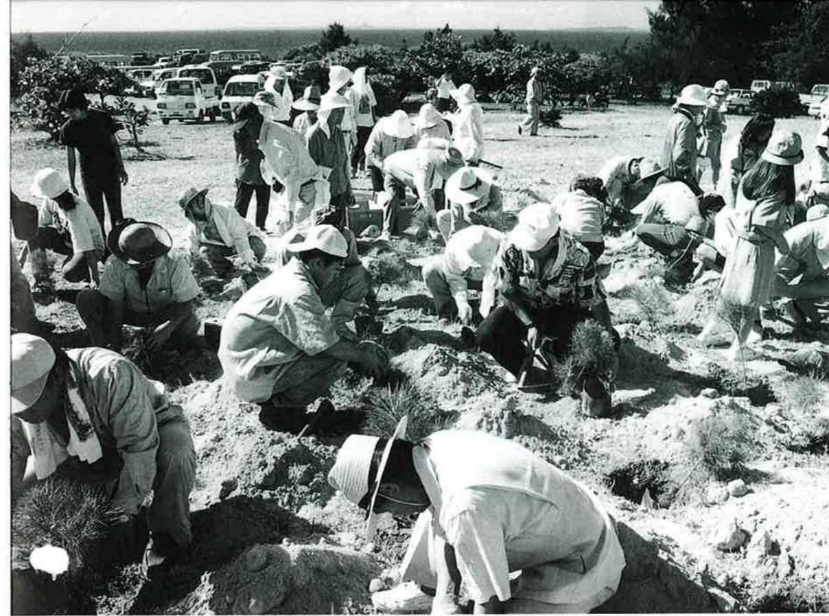
▲琉歌にも詠まれた美しい緑を

今回の植樹祭には琉球松の苗木本が用意されました。参加者は苗木を丁寧にポットから取り出し、りっぱに成長するように願いを込めて植樹してました。 植樹を終えたお年寄りの皆さんは琉球松の大きな木の下で遊んだり、マキ拾いをした思い出話に花を咲かせていました。