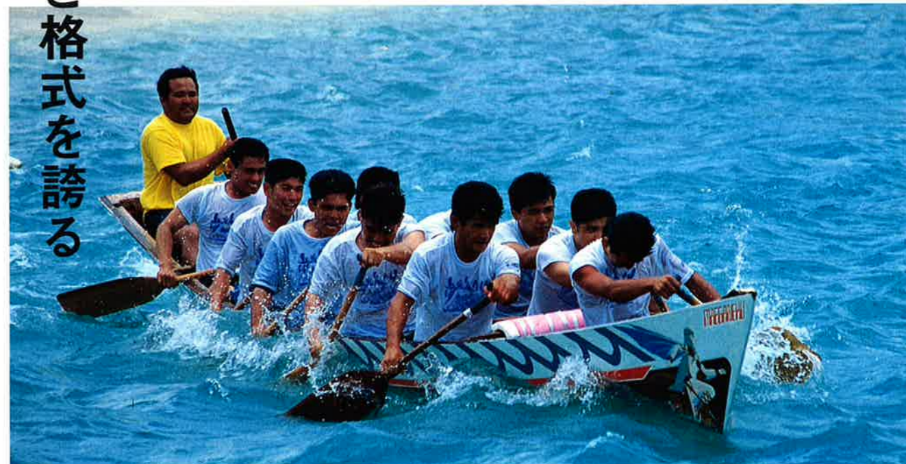
▲前兼久の若者による御願ハーリー