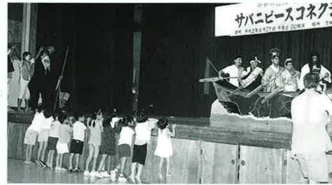
▲舞台では恩納区青年会による楽しい余興が披露された