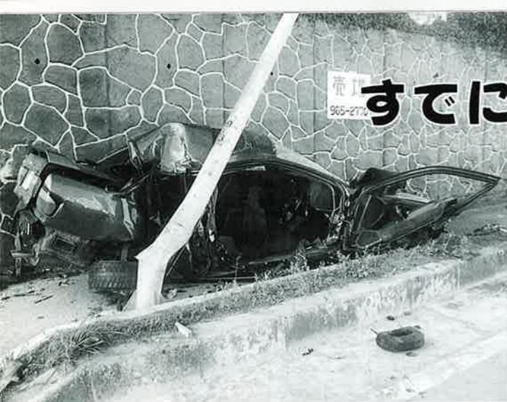
▲交通三悪の追放が死亡事故抑止の第一歩