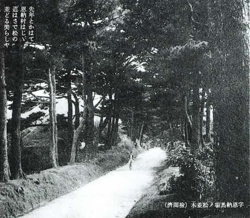
先年とかはて 恩納村はじし 道はさで松の 並どる美らしや

ぼくたちの恩納村は、ほかの市町村より緑が多いと思います。昔の人々が緑を大事にしてきたからだと思います。だから、僕たちも協力して緑を増やしていきたいと思います。きっと恩納村出身の歌人・うんなナビーも天国からこの植樹祭を見てよろこんでいると思います。松の成長を見守ってくださいね。