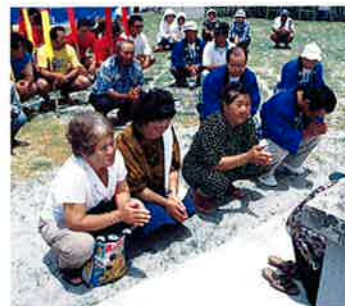
▲区のお年寄りが航海安全と豊漁を祈願