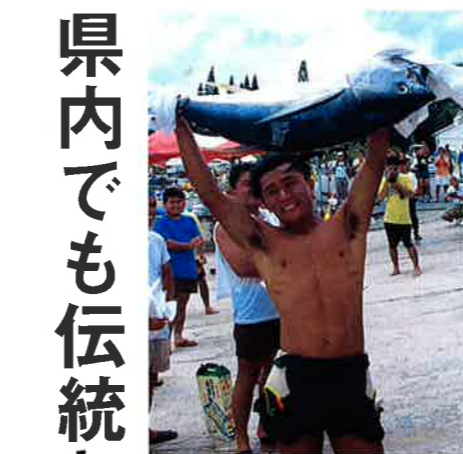
▲優勝チームの賞品はマグロ