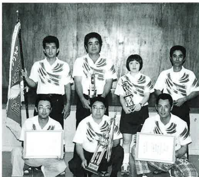
▲2連覇の谷茶区チームのみなさん