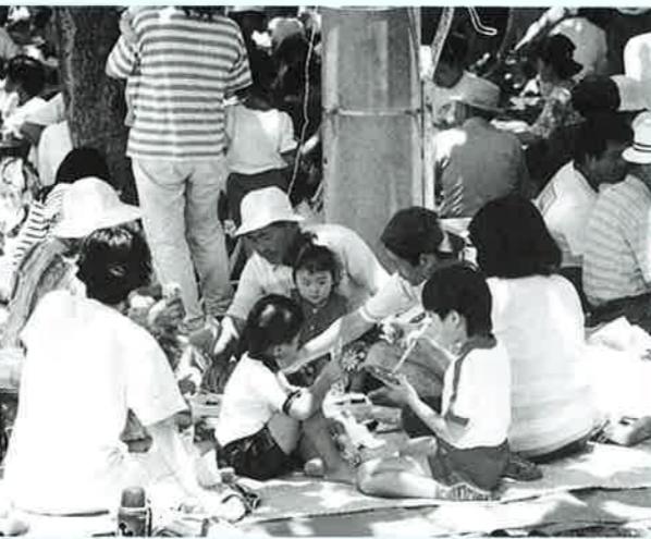
▲家族そろってのお弁当は運動会の楽しみのひとつ

子リレーや各字対抗リレーなど も行われ、子ども達から大きな 声援を受けていました。 昼食時間には、おじいちゃん、 おばあちゃんを囲んで楽しそう に食事をとる光景があちらここ らで見られました。