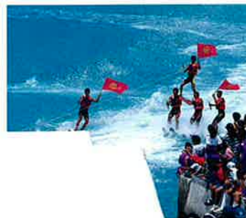
▲ムーンビーチによる水上スキーショー