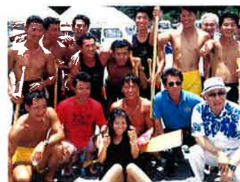
▲職域ハーリー4連覇のサンマリーナホテル