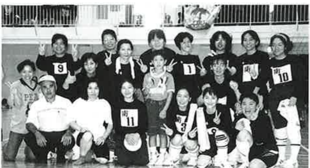
▲初優勝の南恩納婦人会のみなさん

第13回婦人バレーボール大会が6月16日、12チームが参加して山田校体育館において行われました。この大会は、スポーツ活動の楽しさを味わい、健康、体力づくり運動を理解し、併せて婦人会員相互の親睦を図ろうと行われるもので、珍プレーあり好評です。決勝は南恩納と山田婦人会の対戦となり、2-10のセットカウントで南恩納婦人会が初優勝を飾りました。