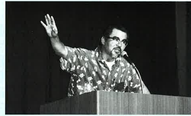
▲地域の文化に誇りを