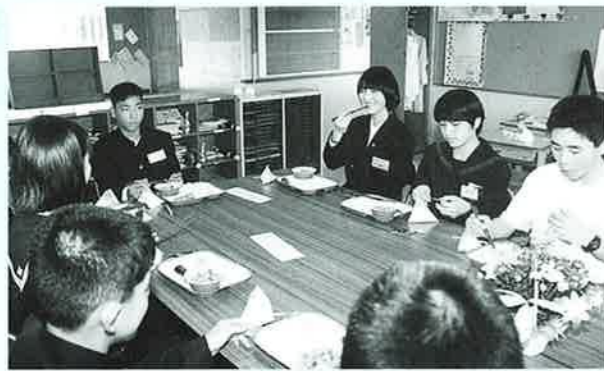
▲恩納村の給食はおいしいね