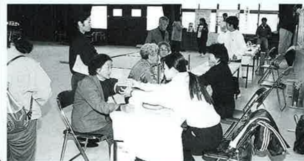
健康展の相談コーナーより