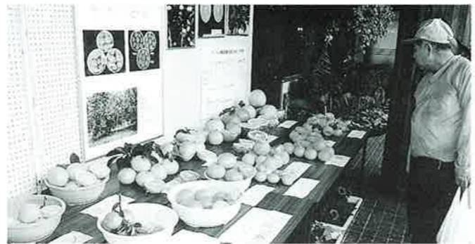
▲第2回うんな農業まつりより