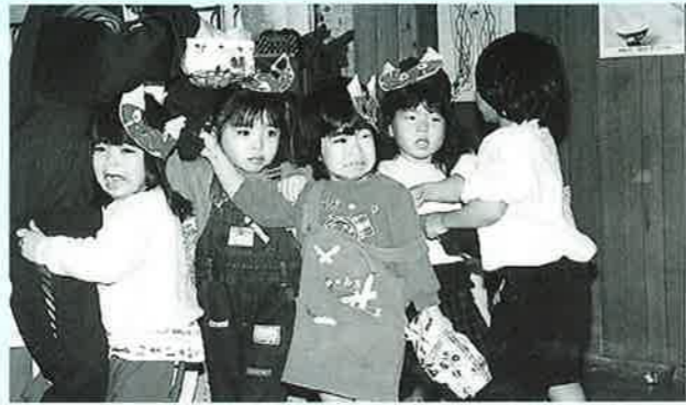
▲こわいよー こわいよー

2月3日は季節の変わり目といわれる「節分の日」。村内保育所、幼稚園では「鬼は外、福は内」と元気よく豆まきが行われました。