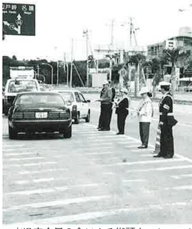
▲交通安全母の会による街頭キャンペーン

県下の交通死亡事故は、大きな特徴として飲酒絡みの事故が、全死亡事故の51%を占め、全国・九州平均の2倍で推移する最悪の実態があります。