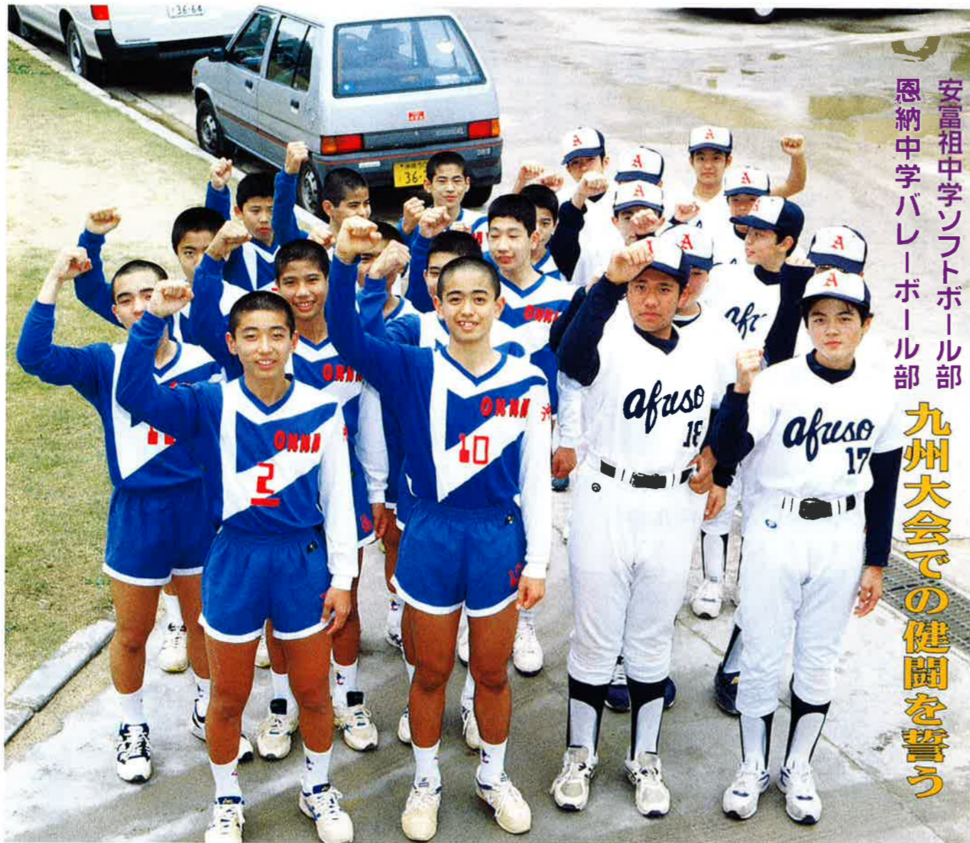
安富祖中学ソフトボール部 恩納中学バレーボール部

平成8年3月1日発行 (No.185) 恩納村役場 総務課 TEL(098)966-8006