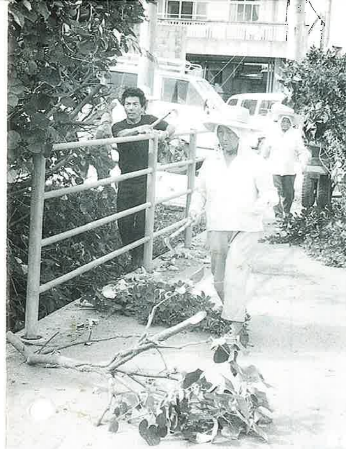
▲美化活動に励む富着区民の皆さん