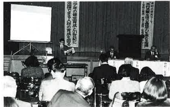
▼子ども達の知・徳・体の向上を

この成果発表会は、学力向上対策事業の成果と課題を評価・確認し、今後の活動に役立てようと実施されています。 学校やPTA代表による諸活動の報告が行われたほか、児童生徒らによる成果発表が行われました。