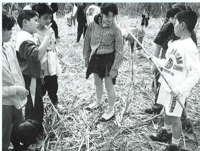
▲サトウキビを見るのも初めて

雪深い岩手県種市町の子ども達20名が、喜瀬武原小中学校の児童生徒と交流を深めました。 種市町は、太平洋岸の青森県との県境に位置する人口1万6千余りのウニなど磯漁業の盛んな町です。 2月14日、恩納村を訪れた一行は喜瀬武原小中学での歓迎交流会に臨みました。歓迎のあいさつと、喜瀬武原の子ども達からはエイサーが披露され、種市町の子ども達も「芭蕉布」の歌を全員で合唱しました。 この後、子ども達はキビ刈りを体験。最後には、喜瀬武原の子ども達と机を囲み楽しく給食をとりました。