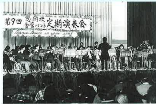
▲詰め掛けた観客を魅了

2月17日、恩納中学校体育館において、同校金管バンド部の第9回定期演奏会が行われ、三百名余りの観客が詰め掛けました。同校金管バンド部は、県コンクールでの銀賞の受賞、うなまつりのオーブニングを毎年つとめるなど活発な活動を続けています。