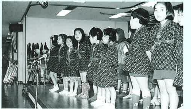
▲おじいちゃん、おばあちゃんいつまでも元気でね

恩納幼稚園の園児42名が、2月6日に谷茶の丘老人ホームを訪れ、お年寄りの皆さんに歌や踊りを披露しました。