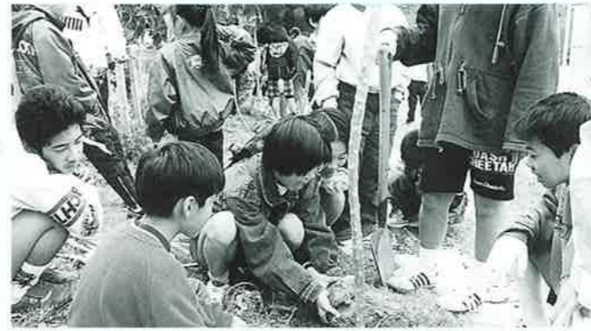
▲花が咲くのが楽しみだね

2月10日、11日の二日間、浦添市民体育館において開催された第18回沖縄青少年科学作品展において、山田中学校が学校活動賞を受賞しました。 この作品展は「教室から未来へ飛び出す僕らの科学」をメインテーマに沖縄教育庁・沖縄電力株式会社の主催により開催されたものです。 青少年の科学の芽を伸ばす事を目的に開催される同作品展には全県から優れた研究作品が多く出展されました。 山田中学校は「野鳥とコウモリ」を研究テーマにした作品のほか、積極的な科学研究への取り組みが高く評価され、今回の活動賞の受賞となりました。