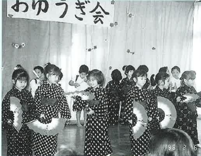
▲女の子はかわいらしく