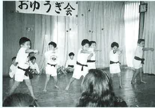
▲元気で気合いをいれて

なかには泣きだして保母さんに抱きつく子、「こわいよー」と逃げ出す子どもさまざま。保育園では微笑ましい節分風景が繰り広げられました。