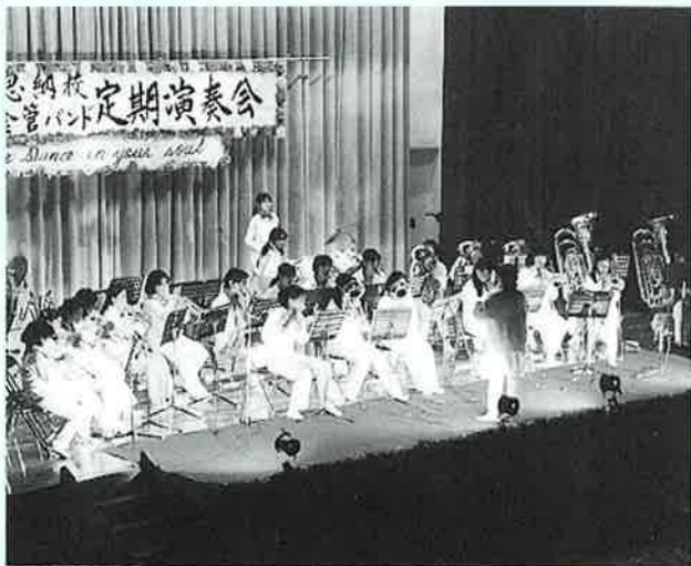
▲三年生にとっては最後の晴れ舞台