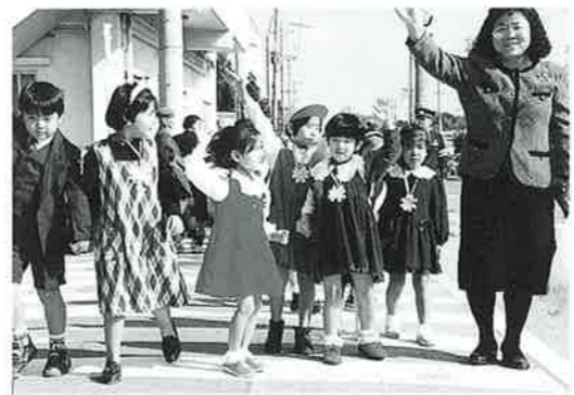
▲横断歩道は手をあげて

4月は、新入園・新入学の季節です。子どもたちが、元気に保育所や幼稚園にいたり、登校する姿はかわいらしいものです。 ドライバーのみならずスクーターや「子どもの飛び出しに注意」の看板があるところでは注意して運転して下さい。 家庭では、子どもたちと一緒に通学路や家の周りを歩き、道路の横断の仕方、信号の見方などを教えてあげましょう。