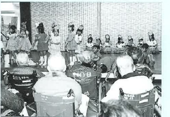
▲「ねずみの嫁入り」かわいい演技にっこり