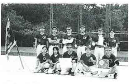
▲優勝したサンマリナーホテル