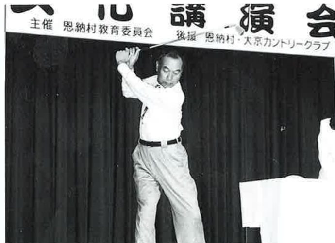
▲正しいスイングは強い足腰から

三千名余りいるプロゴルファーのなかで脚光をあびているのは、ほんの一握のプロゴルファーだけ、華やかに見えるプロゴルフの世界も大変厳しい世界とも話していました。 クラブを握り実技の指導に話がすすむと、後ろの席の参加者は身を乗り出し説明に聞き入っていました。