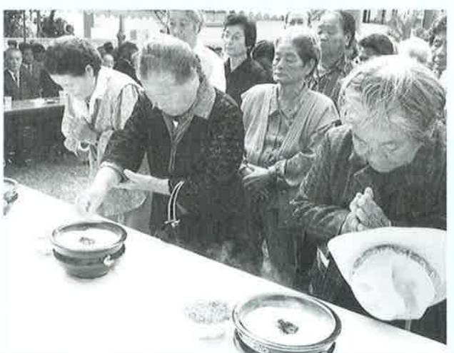
▲手をあわせれ永久平和を願う

11月13日、遺族をはじめ約二 百名が参列し、慰霊の塔で第42 回戦没者慰霊祭が行われまし た。 全員で黙とうを捧げたあと、 各団体を代表する参列者から は、戦没者の霊を慰めるとも に戦後の経済復興を支えた遺族 の苦勞に、ねぎらいの言葉が送 られました。 遺族会からは「終戦から五十 年が経過し、戦争体験者の高齢 化が進んでいる。戦争の悲惨さ と平和の尊さを後世に伝えるた め全力を尽くす」と挨拶があり ました。 各代表の献花が行われたあと 一般焼香が行われ、目頭を押さ える遺族の姿が、平和への祈り を一層切実なものにしました。