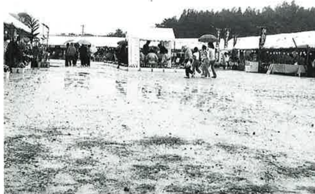
▲今年は漁港敷地まで会場をひろげ開催された

ホールでは熱帯果樹や園芸作物の展示やパネル紹介、関心を持つ人が熱心に見て回っていました。 野外では野菜、果実のほか海ぶどうやアーサなどの海産物も展示即売されており、市価より安いとあって大根などの野菜を束で買う人が目を引きました。