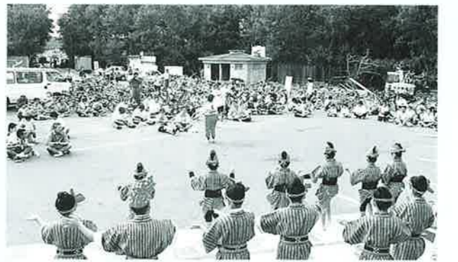
▲琉球舞踊を見ながら真栄田岬で昼食

やんばるの秋の風物詩ともなった「ツール・ドおきなわ」。 11月10日、12日、名護市を中心に北部各市町村を回るコースで開催されました。 「やんばるはひとつ」を大会スローガンに、やんばるの活性化を目指すもので、今年で七回目をかぞえ北部地域の一大スポーツイベントとして、国内はもと