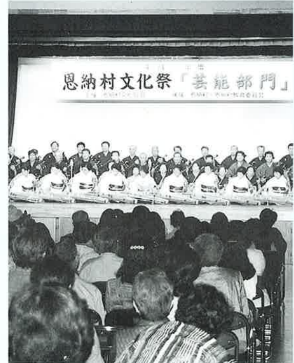
▲古典音楽部会による幕開け