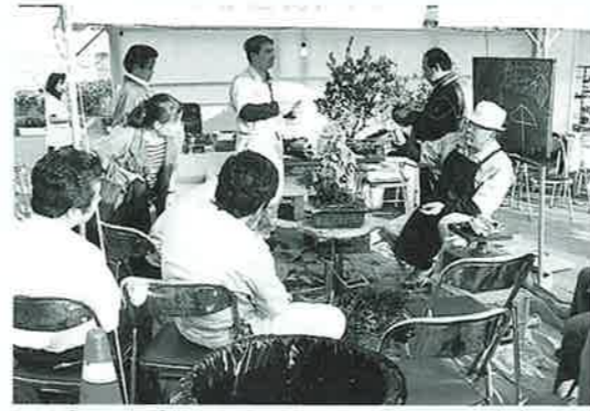
▲人気の盆栽コーナー

「地域と共に五十年。犯罪事故のない明るく住みよい地域社会の実現をめざして」。 石川警察署まつりが11月25日、同署内を会場に行われました。 子供たちを白バイにのせて写真をとるなど、多くの家族連れでにぎわいました。 玄関先の特設ステージでは小