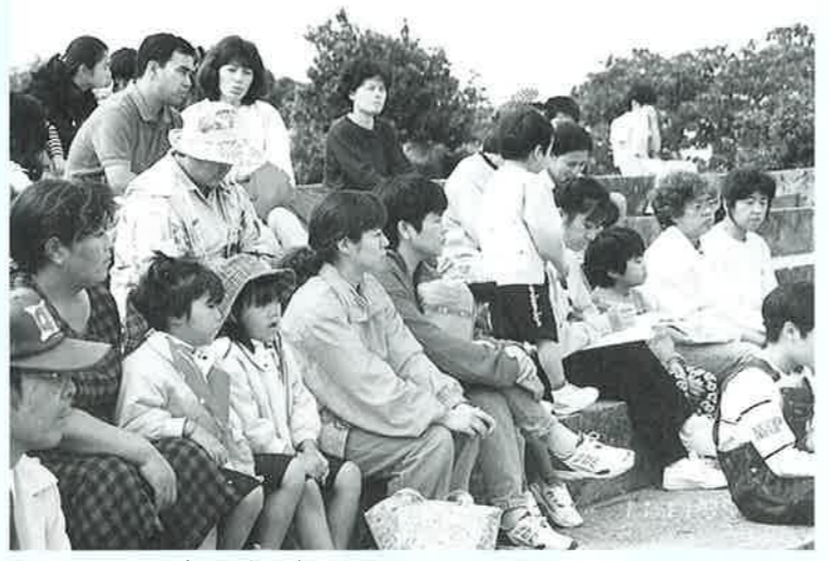
▲歴史を再認識した参加者