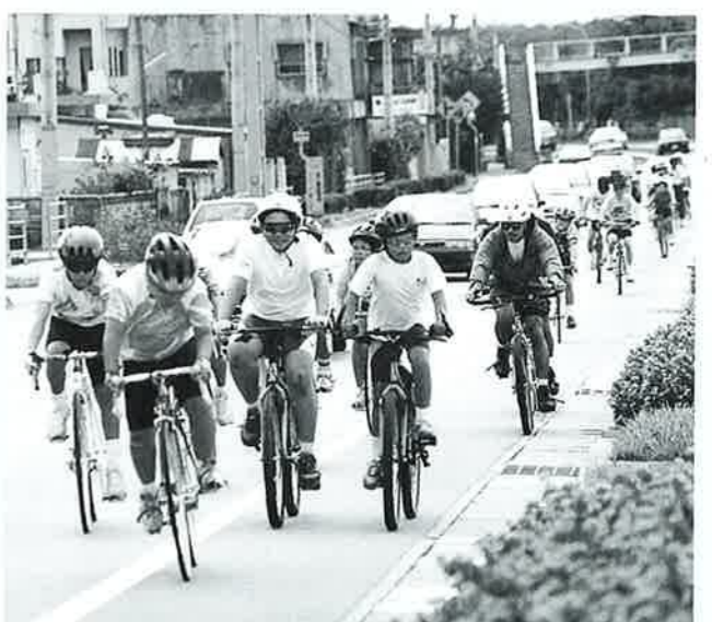
▲風をきって走る参加者

定着しています。 恩納村ではファミリーサイクリングが、名護市民会館を出発、真栄田岬折り返しのコースで行われました。 参加者は家族連れを中心に二百名が参加しました。美しい恩納村西海岸の景観をバックにマイペースでペダルを踏んでいました。