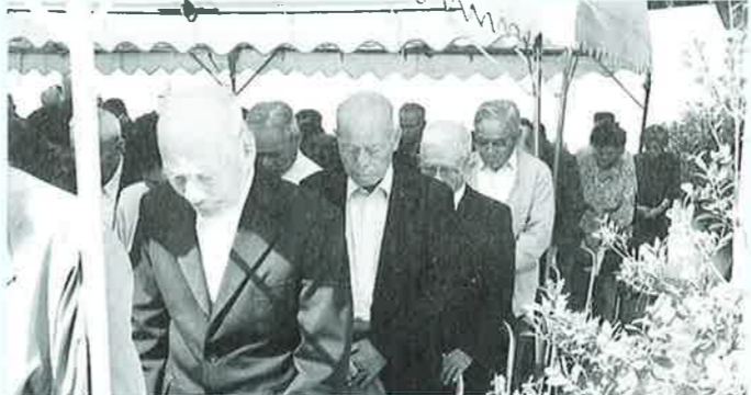
▲それぞれの思いで黙とうを捧げる出席者