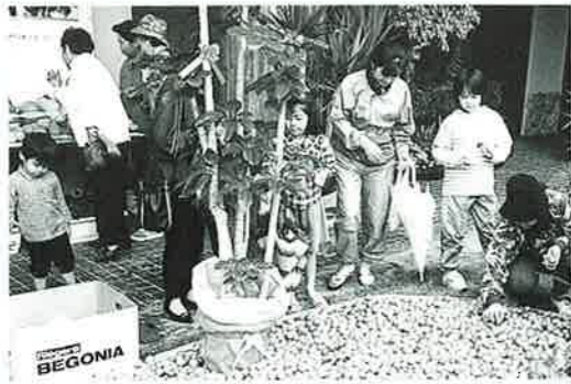
▲みかんをご自由にどうぞ

地域農業振興推進協議会の主催による「第2回うんな農業まつり」が12月16、17日の両日、コミュニティセンター周辺広場で開催されました。 恩納村で生産された農産物、加工品を一同に展示。地元で取れた新鮮な産物を買求める家族連れでにぎわいました。