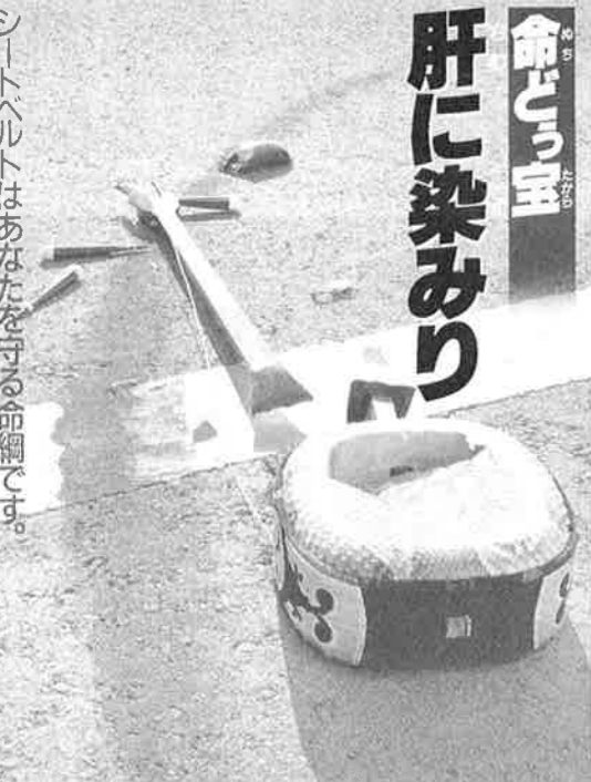
恩納村交通安全推進協議会・石川警察署・石川地区交通安全協会・石川地区交通安全母の会