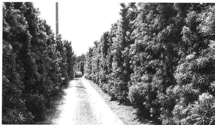
イヌマキ(チャーギ) 植付後九年目