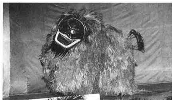
名嘉真区の獅子舞 (雌)

当時コレラが発生し、その魔よけとして獅子舞がおこなったとも伝えられています。また、恩納間切り北の名嘉真村に雌獅子、南の山田村に雄獅子が置かれ、恩納間切りの守り神として獅子舞が行われたと伝えられています。