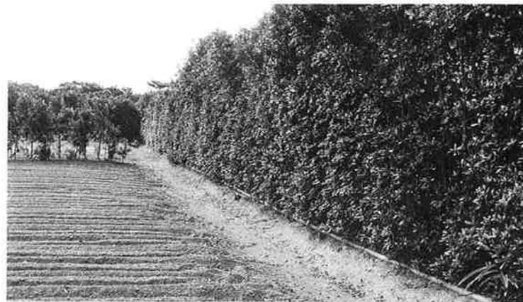
シャリンバイ(テイカチ) 実生から五年目