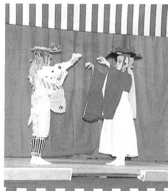
蝶ぼたん (舞踊) : 仲泊区