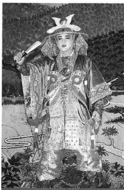
忠臣身替 (組踊り) : 恩納区