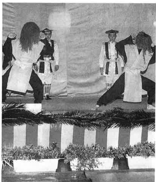
南の島 (フェーヌシマ) : 名嘉真区