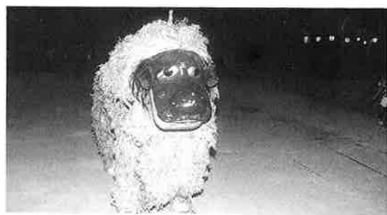
山田区の獅子舞 (雄)

当時コレラが発生し、その魔よけとして獅子舞がおこなったとも伝えられています。また、恩納間切り北の名嘉真村に雌獅子、南の山田村に雄獅子が置かれ、恩納間切りの守り神として獅子舞が行われたと伝えられています。