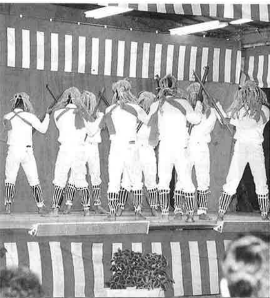
南の島 (フェーヌシマ) : 仲泊区