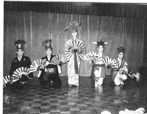
松竹梅 (舞踊) : 瀬良垣区

第一部は琉球舞踊が中心に行われ、一部においては、それぞれの区の特徴ある演劇(組踊り)が披露されました。