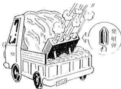
時限式爆発物発射装置