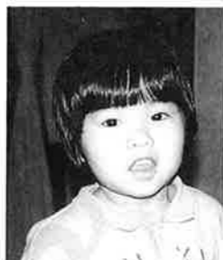
あずまにじのちゃん