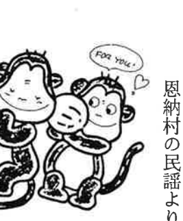
恩納村の民謡より

旅人が丘を越えて旅立った頃、二人はふろに入りました。するとどうでしょう。二人はさっそくふろを沸かし一包みの粉を解かし、ふるにはいりました。若くするとどうでしょう。若くならずがよい。」