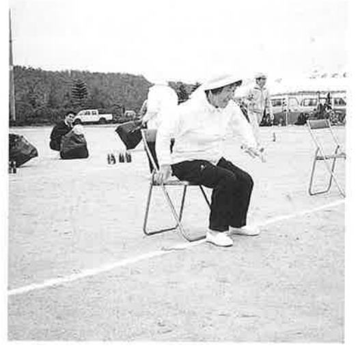
さて本日のケツ庄は いかかかしら？ うまく割れたかその風船