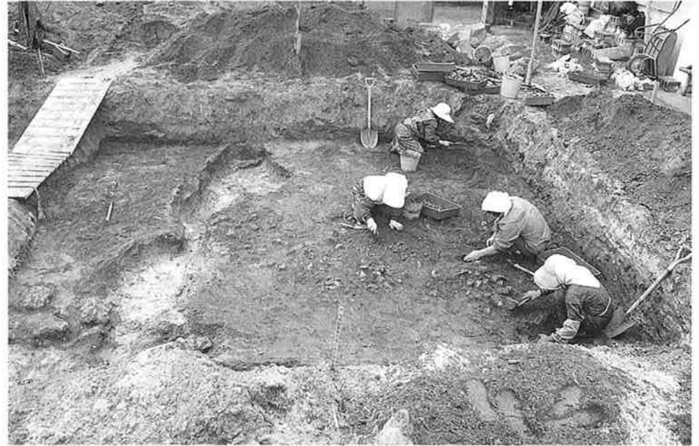
住宅建築予定に於ける発掘作業(熱田貝塚)

村内には、仲泊貝塚など十二の貝塚があることが知られています。これらの貝塚からは、三千年前から一