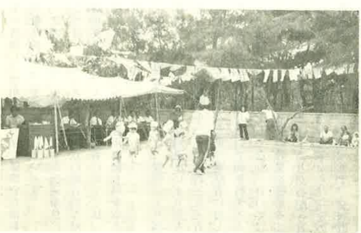
(保母と園児との一緒にゆうぎ)

動会を催しました。 この日は、晴れあがった秋空の下で、緑につつまれた広場に六〇名の保育園児と父母が