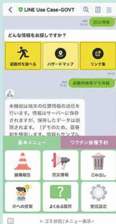
プログラムのデモ画面