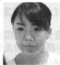
ヘアメイクアーティスト

米国生まれ。大学卒業後、日系・外資系にて役員秘書として働き後輩の育成を行う。企業の管理職時には子育て中の女性スタッフによるワークシェア体制を導入。海外事業23年の経験を生かして2011年に起業。現在企業の海外ビジネスサポート、教育事業等幅広く展開中。