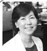
株式会社リエゾン・テール 代表取締役