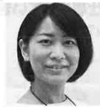
株式会社スタイリスティックス 代表取締役 非営利型一般社団法人リトル・ミュージカル 代表理事

美容師を経て撮影所に所属し、映画・ドラマ・CM等に携わりその後独立。フリーランスにてCM・ドラマ・舞台等メディアの仕事を中心に活動中。出産を機に、働き方を自ら試行錯誤した経験と、役作り・イメージ作りをメイクを通して身近に「綺麗」「楽しい」を感じてもらえるような活動を推進中。