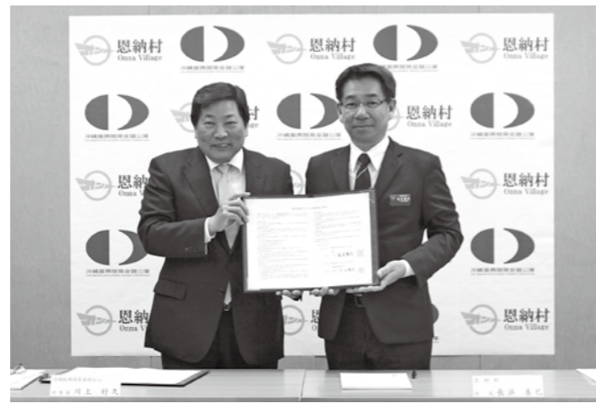
(左から) 川上理事長、長浜村長

助言業務協定により、恩納村と沖縄公庫との連帯が強化され、地域の活性化が期待されます。